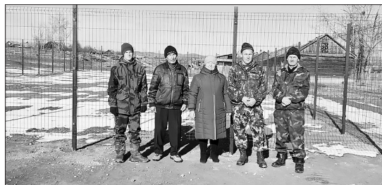
У ограждения футбольного поля