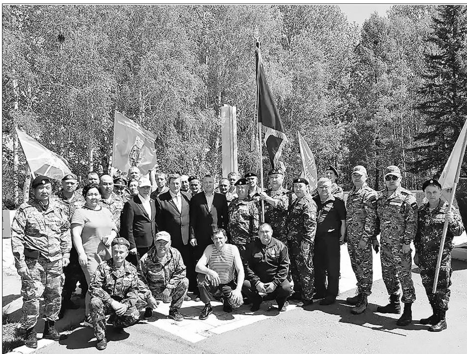
В парке Победы

В районной администрации состоялась церемония торжественного открытия Бичурского отделения «Боевого братства». Из-за ограничений по ковиду в прошлом году это мероприятие провести не удалось. 4 июня местное отделение открыли официально.