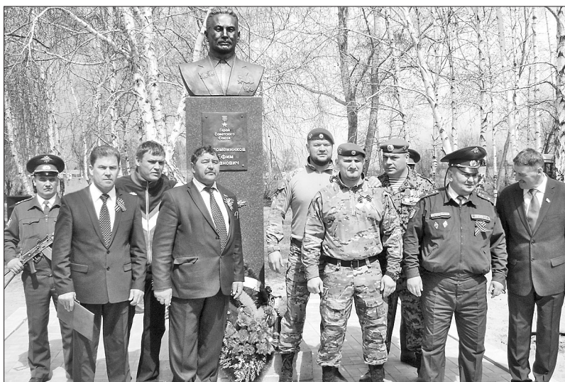
Память о героическом подвиге нашего земляка навсегда останется в сердцах бичурян

Почетное право открыть памятник предоставляется ветерану спе-