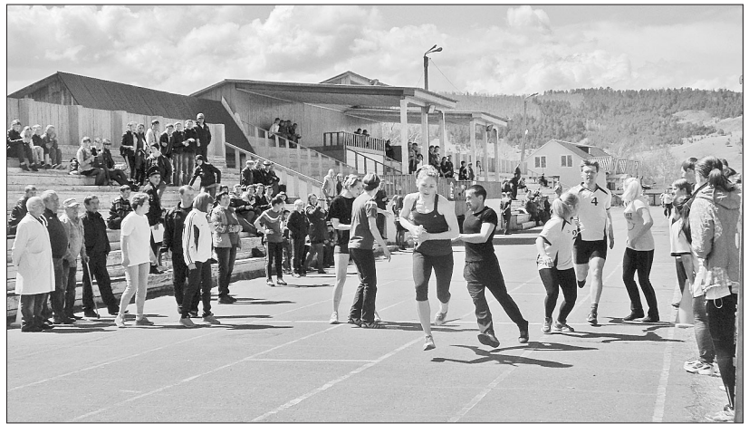
Ответственный момент — передача эстафетной палочки

В этом году легкоатлетическая эстафета, посвящённая Дню Победы, прошла на Центральном стадионе