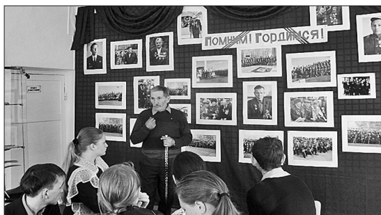
Это будет постоянной экспозицией музея «Родина»