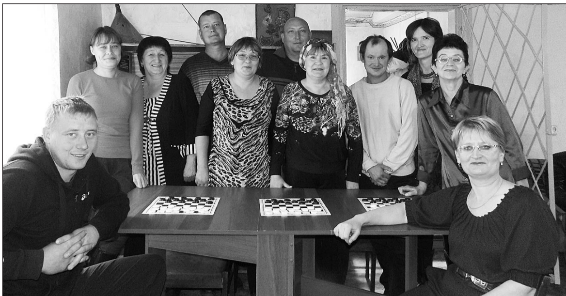
Соревнования проходили в хорошем настроении

Восемь игроков приняли участие в интеллектуально-спортивной игре