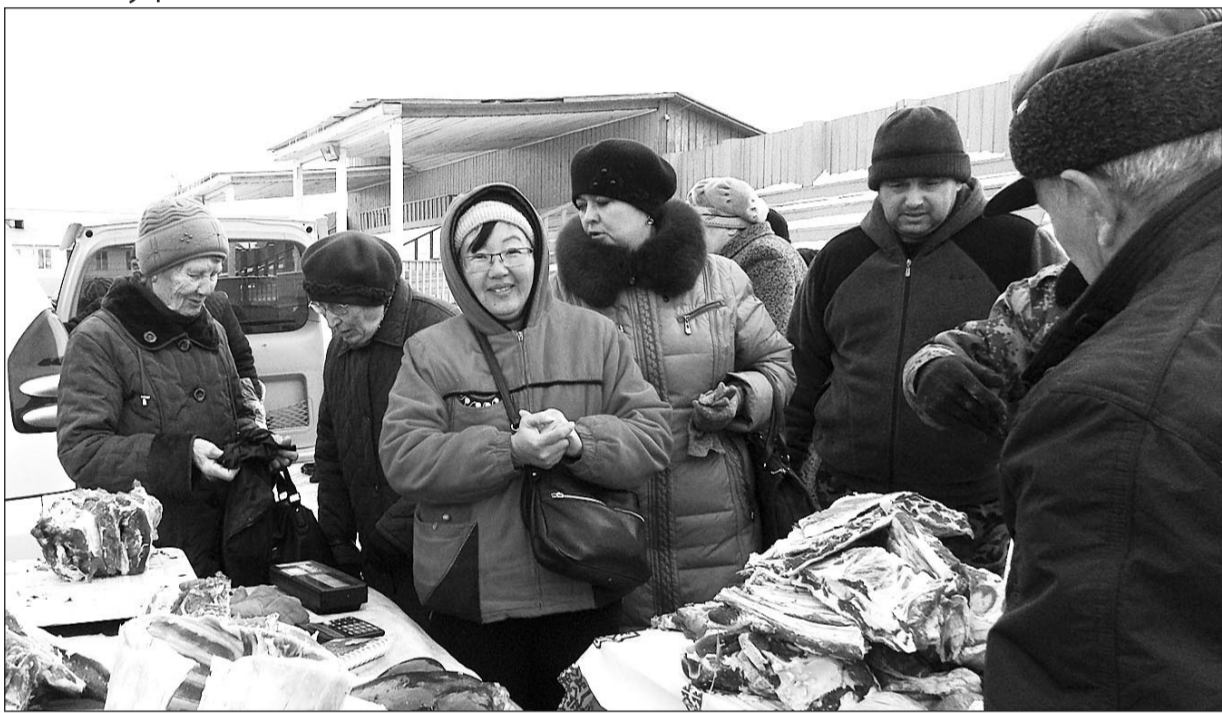
«Подходи — приценийся, покупай — не стесняйся!»

Выставка-продажа сельхозпродукции состоялась в Бичуре