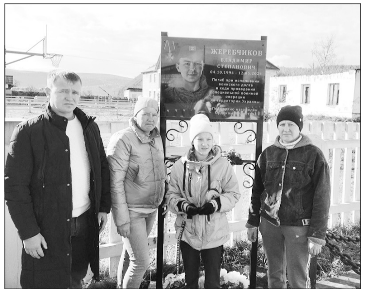
В сердце навсегда