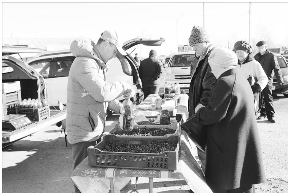
Спрос был и у прилавка гостей из Баргузинского района

11 октября в Бичуре состоялась традиционная осенняя ярмарка. Продукцию предоставили две сельскохозяйственные организации, три ИП, четыре КФХ, 14 личных подсобных хозяйств района.