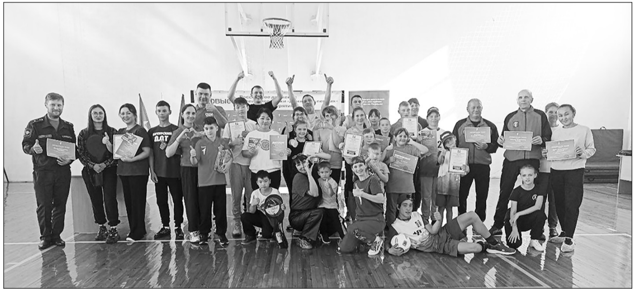
Все мы дружим со спортом

Юри подвело итоги спортивного семейного праздника. В старшей возрастной группе первое место у семейной команды от Бичурской школы № 3, которую представляли Ольга