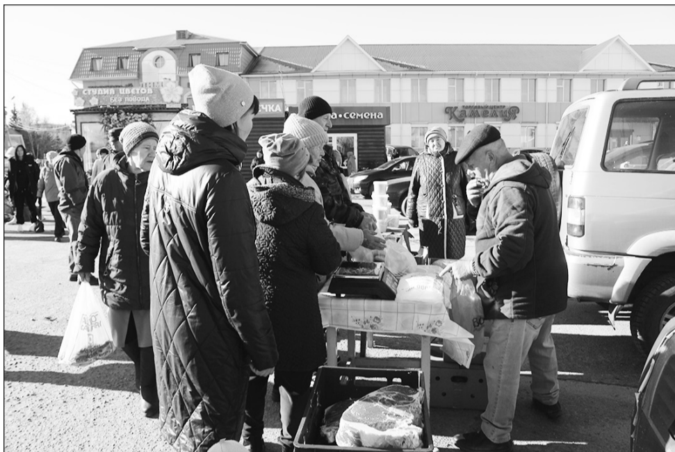
Бойко шла торговля хлебобулочными изделиями