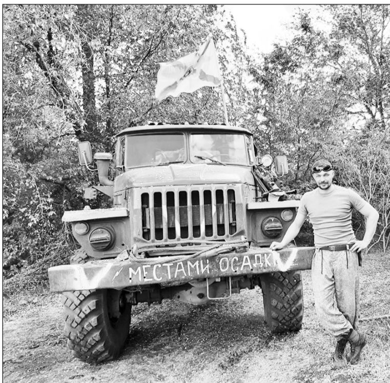
Рядом с боевой машиной «Град»