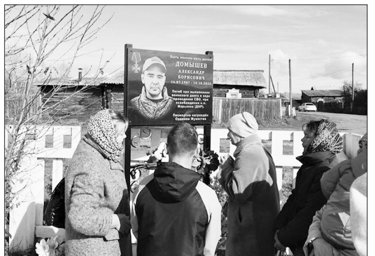
В памяти земляков