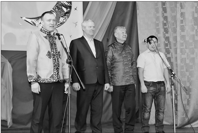
Приветствие от почётных гостей

Фестиваль бурятского фольклора проходил в Шибертуе