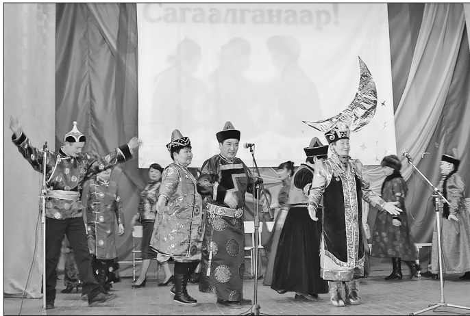
«В праздник Белого месяца только доброе ценится, только в светлое верится...»

В Доме культуры собрались участники праздника из пяти сельских поселений Бичурского района — Дунда-Киретского, Среднехарлунского, Хонхойского, Шанагинского и Шибертуевского, представители районной власти, почётные гости, зрители.