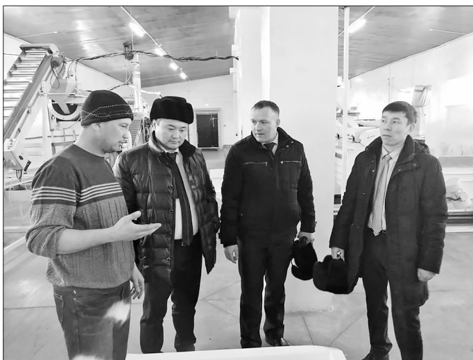
Посещение предприятия по переработке орехов и черемухи

— Сегодня Бичурскому району сложно найти инвесторов. Район находится вдали от федеральной трассы и железной дороги, —