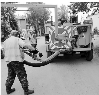
Техника для ямочного ремонта