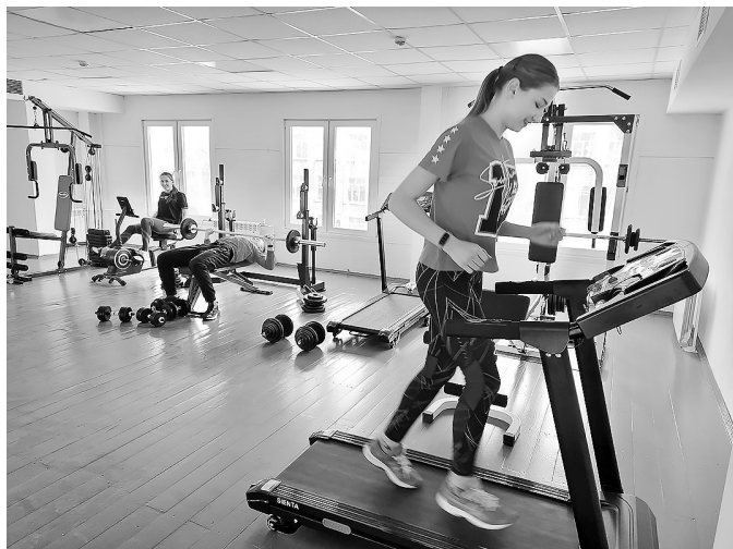
Тренажерный зал в ФСК