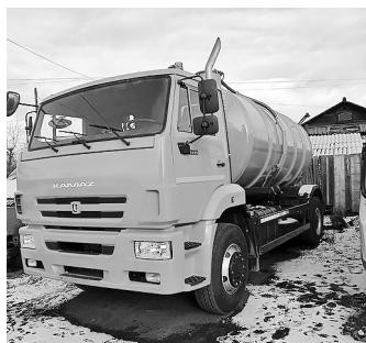
Вакуумная машина (ассенизационная)