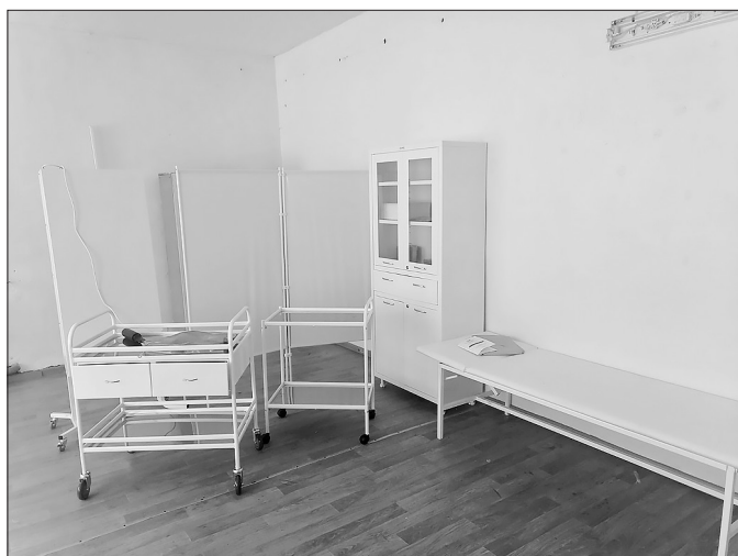
Медкабинет в Малокуналейской школе