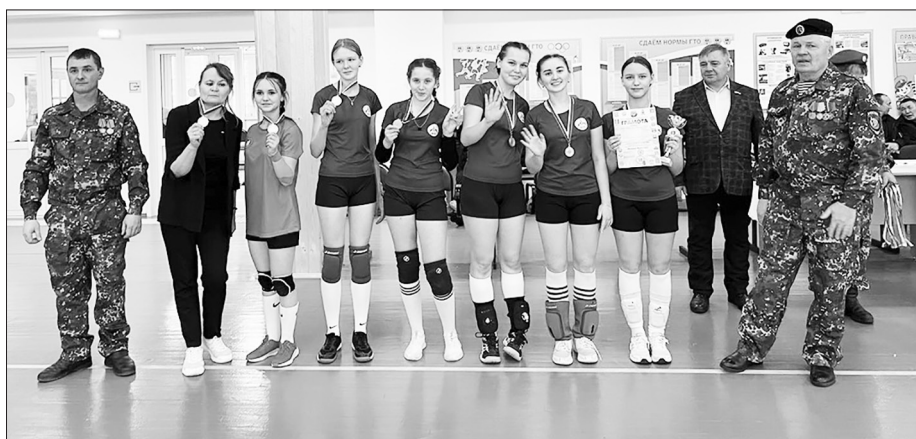
Волейболистки — победители турнира