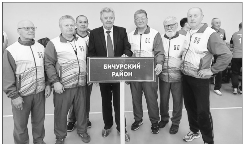
Республиканские соревнования по волейболу среди пенсионеров