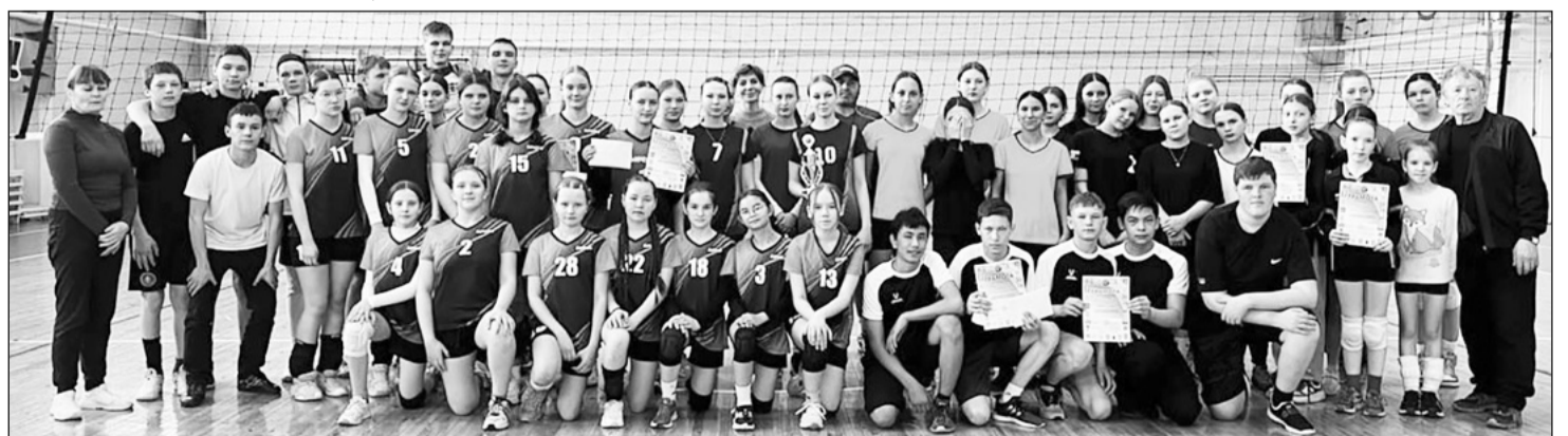
Соревнования на кубок боевого братства