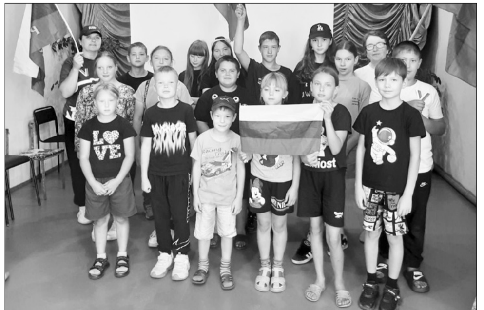
Детские соревнования в честь флага России в Кирети