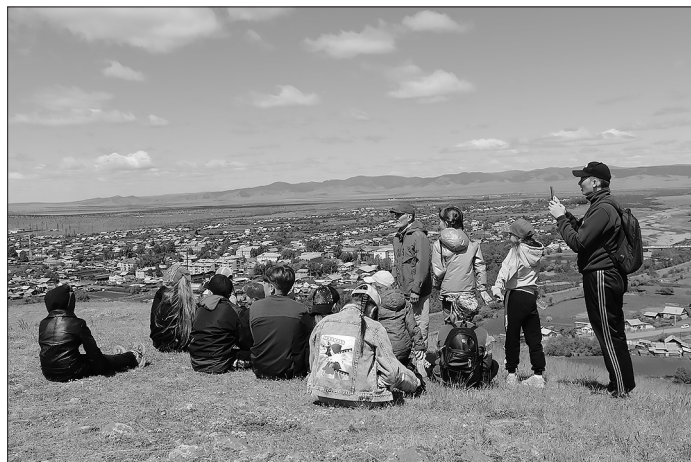
На экскурсии ученики Бичурской школы №5

— 20 июня ребята участвовали в образовательной экскурсии «Бичура семейская». Это замечательный и содержательный тур, где нас познакомили с историей расселения, культурой, бытом старообрядцев Бичуры. С умным и эрудированным экскурсоводом Д.А. Андроновым мы побывали в знаковых для Бичуры местах, посетили богатейший музей. Ребята остались довольны. Желаем туру дальнейшего развития и продвижения, выхода в интернет-пространство, где любой смог бы узнать об уникальной культуре «семейских».