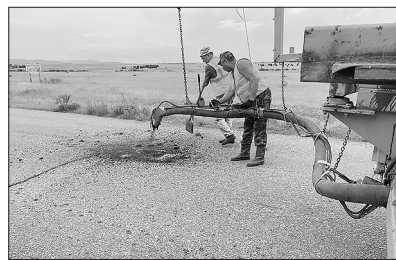
На подъезде к селу Елань