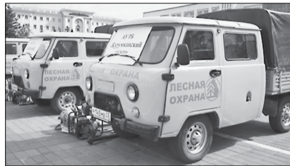
Лесопатрульные машины уже помогают тушить пожары в лесах Бурятии