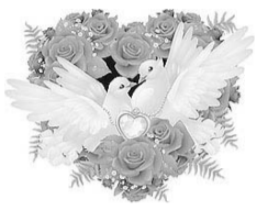
Дети, зятя, невестка, внуки

У вас сапфировая свадьба — Люви триумф очередной! Совсем немножечко осталось До вашей свадьбы золотой! Почти полвека храм семейный Сумели вы оберегать. Спасибо вам за это дело, Хотим сегодня мы сказать! Пусть дальше так легко и ловко Дорога жизни вас ведет, И пусть здоровье, смех и радость, Вас никогда не подведут!