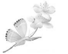
Муж, дети, невестка, зятя, внуки.

Мама, бабушка, жена, Для нас всех она одна! Благодарны мы судьбе, Что достались все тебе! Пусть здоровье бьет ключом, Мы всегда с тобой во всем. От улыбочки твоей, На душе всегда теплей! Ты, как лучик, солнца свет, Мама — тебя прекрасней нет! Любим все тебя с душой, Нашей дружную семью!