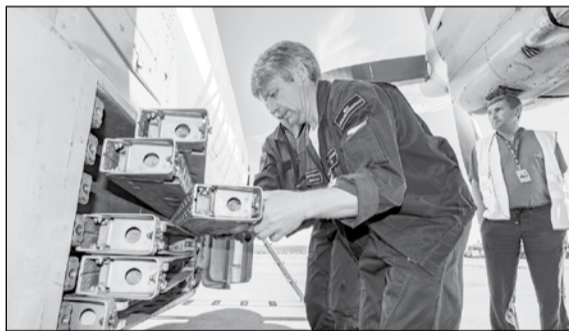
Закладка пиропатронов в самолет АН-26 для искусственного вызова осадков