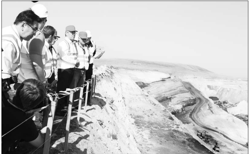
На смотровой площадке угольного разреза