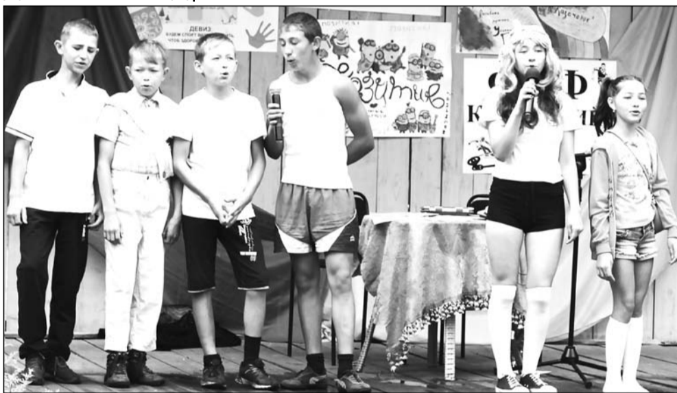
Выступление команды «Оба-на»

Традиционный летний праздник для детей и подростков