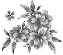
Муж, дети, внуки

Дорогая наша, с юбилеем! Шестьдесят — не повод унывать. На тебя посмотришь — не поверишь: Красоту с годами не отнять. Главное, чтоб было настроение, Чтобы жить хотелось и творить. Пусть уйдут ненужные сомнения И счастливой не мешают быть!