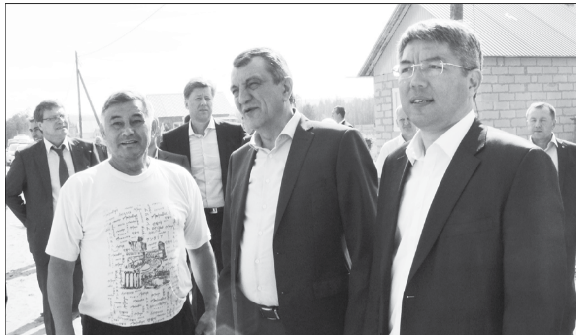
Полномочный представитель президента России в СФО Сергей Меньяло и исполняющий обязанности Главы Бурятии Алексей Цыденов проверили, как идет строительство домов после пожара в селе Черемушки

Благодаря оперативным действиям правительства Бурятии и лесной охраны ситуация с пожарами в регионе остается под контролем. В текущем году возгорания тушатся в четыре раза быстрее