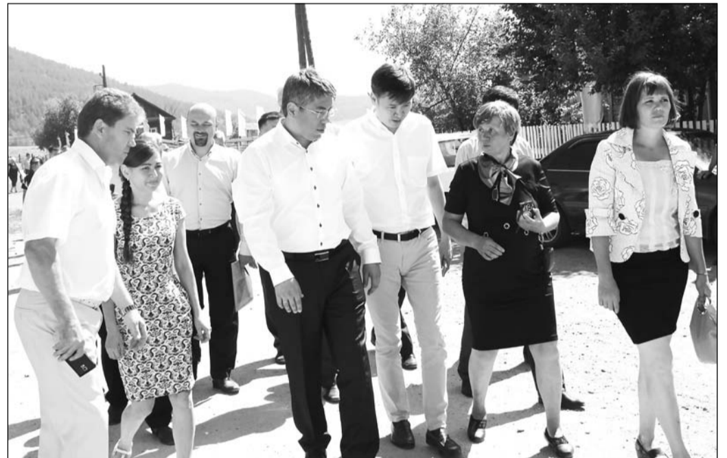
С жителями Верхнего Мангиртуя