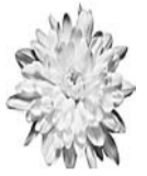
Жена, дети, внуки, правнук

Есть возраст особый, он «мудрость» зовется. Добро на закате добром отзовется, Откликнется дружбой, любовью родных, А мудрым не нужно богатств ведь иных! Семьдесят лет — прекрасная дата. Поздравить тебя с ней сегодня мы рады! Хотим пару слов тебе добрых сказать — Здоровья стального тебе пожелаю!