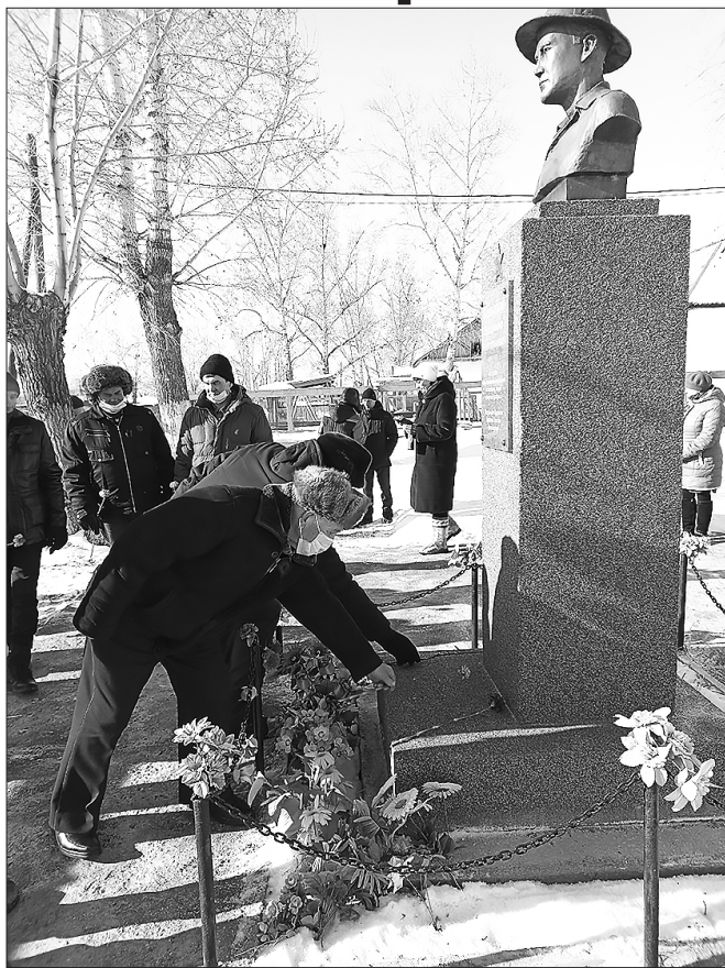
Память сохраним... В п. Сахарный Завод

В Бичурском районе 15 февраля прошли мероприятия, посвящённые памятной дате, 33-ей годовщине вывода советских войск из Афганистана.