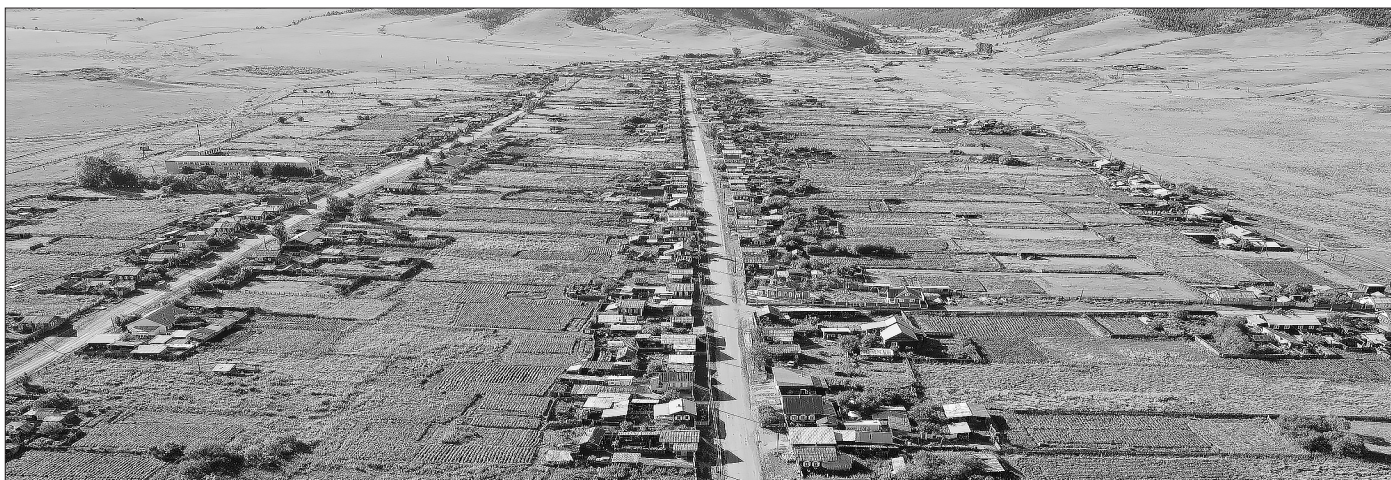
Панорама села Новосретенка. 2021 г.

100 лет назад открылась первая страница истории села Новосретенка