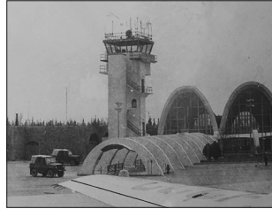
Аэродром «Чкаловский» — первое место службы