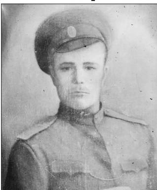
Имя ещё одного земляка — борца за советскую власть — сохранилось в названии еланской улицы.