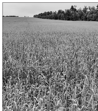
На полях ООО «Гранд»