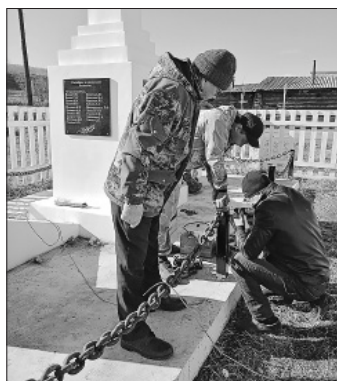
Жители села Поселье отреставрировали памятник участникам войны

В 2020 году поселению выделено 294,6 тыс. рублей из бюджета республики на первоочередные расходы (Народный бюджет), в том