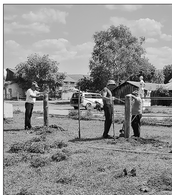
ТОС «Орбита» на ограждении детской игровой площадки

Полномочия по содержанию дорог Посельское поселение не принимало, поэтому обслуживанием занимался хозяйственно-транспортный отдел районной администрации. Проводились грейдирование, ямочный ремонт дороги с асфальтовым покрытием, текущий ремонт мостового перехода, установку дорожных знаков, направлено более 200,0 тыс. рублей.