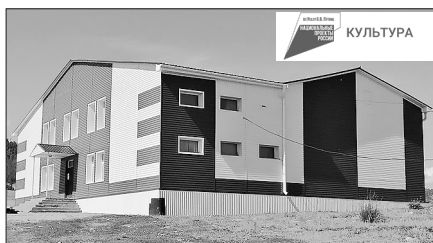
20 июля в Шибертуйе приняли работу по первому контракту

Сложно проходит ремонт клуба в селе Узкий Луг. Здание давно не ремонтировали, помещения находились в ветхом состоянии. Там провели кровельные работы, заменили окна. Ремонтные работы по объективным причинам временно приостановили. В ближайшие дни начнётся утепление и облицовка фасада здания. Ремонт продлится до конца сентября, предстоит установить систему отопления, провести внутренние отделочные и электромонтажные работы. Предстоящую зиму жители села Узкий Луг встретят в теплом, уютном сельском клубе.