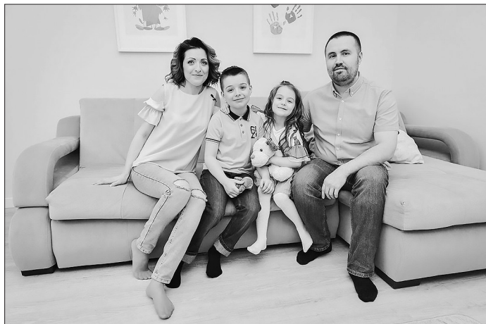
Счастливые обладатели квартиры

Благодаря участию в ПК его пайщики могут удовлетворить различные потребности, подтверждением тому является то, что в апреле 2021 года была утверждена новая целевая программа «Мой автомобиль», согласно которой пайщики ПК получили возможность приобрести в собственность автомобиль.