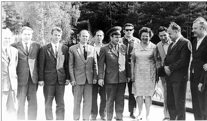
С коллегами: третий слева — К.А. Афанасьев, шестой слева — летчик-космонавт СССР, дважды Герой Советского Союза П.Р. Попович

благодаря разработкам Константина Андреевича наша космонавтика получила надёжные средства космической связи, за что он был отмечен Государственной премией СССР.