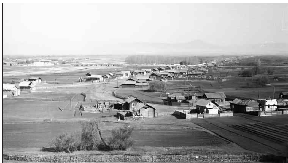
Бичура 1958 г.

Я долго рассматривал фото, и меня не покидало тревожное чувство ожидания, которое сквозило в снимке. В 1927 году состоится XV съезд ВКП (б), который провозгласит курс на коллективизацию и индустриализацию