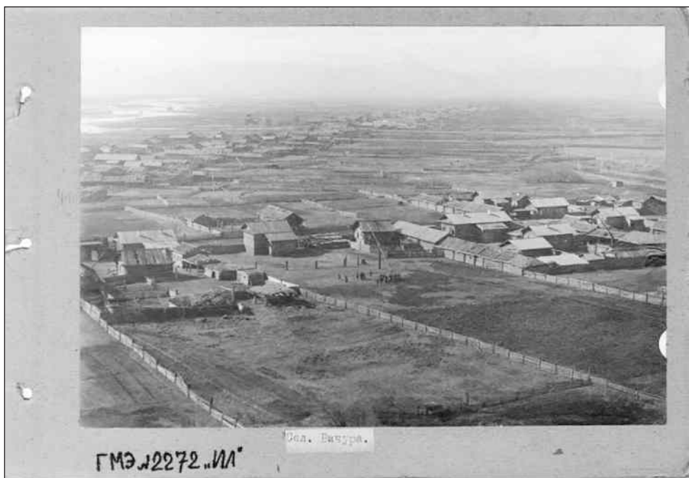
Бичура 1926 г.

Это фото почти сто лет хранится в коллекции Российского этнографического музея. Экспедиция учёных в то далёкое время изучала быт семейских старообрядцев. По правилам проведения подобных исследовательских полевых работ наряду с фотографированием проводились зарисовки. Художники и фотографы фиксировали внешний вид домов, построек, внутреннее убранство, предметы быта, одежду, обувь. По результатам экспедиций учёные писали подробные отчёты, которые составлялись на основании полевых дневников. Фотографии печатались с негативов и наклеивались на паспорт с указанием предмета съёмки, места и некоторых обстоятельств. Например, к фото, где изображены семейские женщины, имеется такая запись: «негатив, группа семейских женщин, гуляние на Троицу», или «сапоги кожаные женские, Бичура».