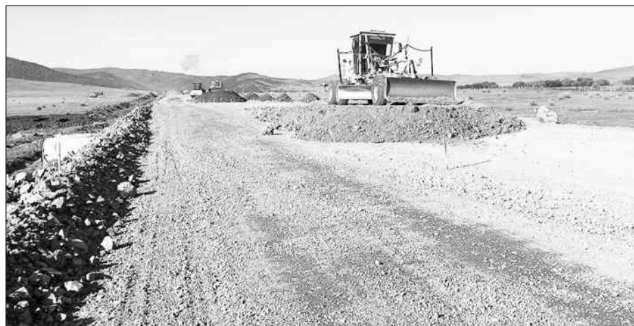
Работает тяжёлая техника