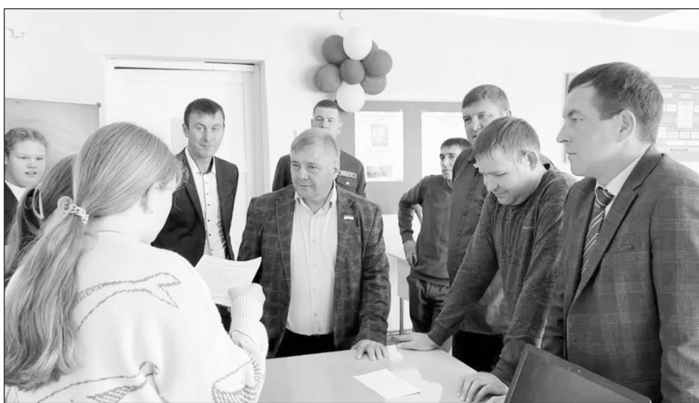
На станции «Интеллектуалы»

После беседы команда отцов и команда будущих пап — мальчиков-старшеклассников — соревновались в игровом квесте. Они проходили маршрут по станциям, расположенным в разных кабинетах школы, и выполняли задания. На станции «Интеллектуалы» отвечали на вопросы на сообразительность. Затем каждый пришивал пуговицу. Название третьей