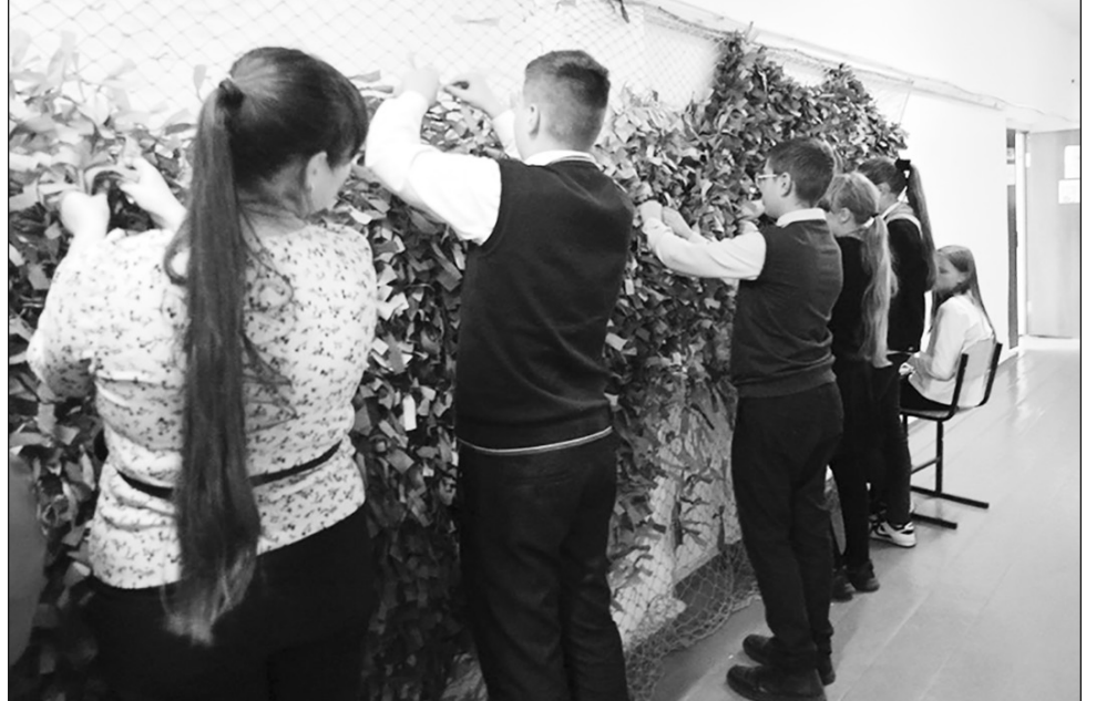
В Бичурской школе №4