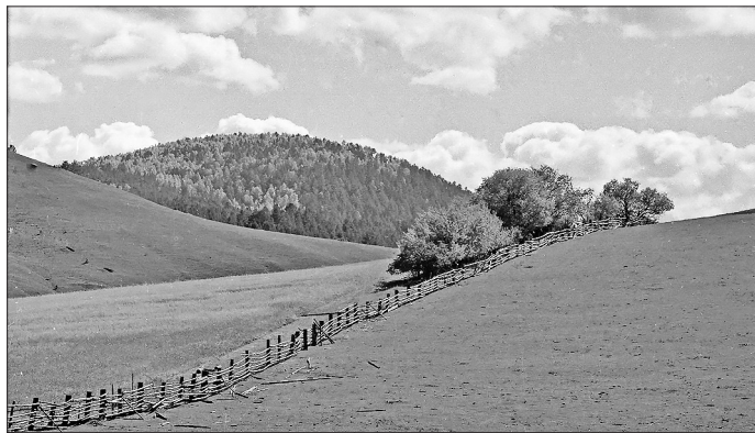
Хоица-гора и колхозный забор. Скан с цветной плёнки. 1996 год