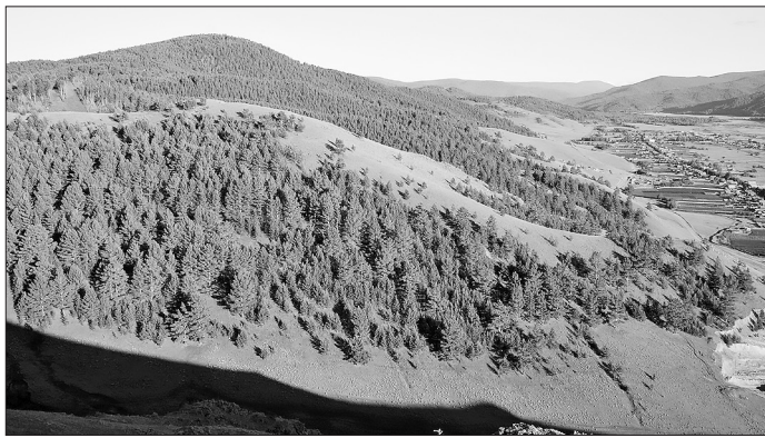
Гора в 2008 году