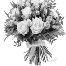
Дети, внуки, правнуки

Ты как всегда полна забот, Ведь жизнь давалась нелегко. Ах, сколько трудных, тяжких дней По сердцу твоему прошло. Ты заслужила в жизни радость На много лет уже вперед. Так будь же счастлива, здорова И каждый день, и каждый год!