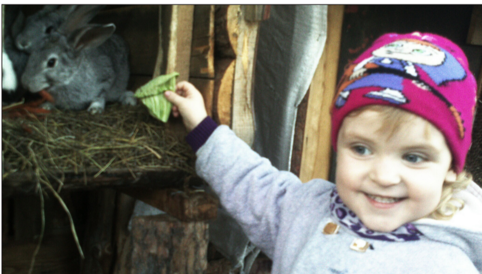
Музыка Рената с потомством от крольчихи Нади: «Пушистые крольчата — весёлые ребята. Их лакомство — морковка, грызут её крольчата ловко»