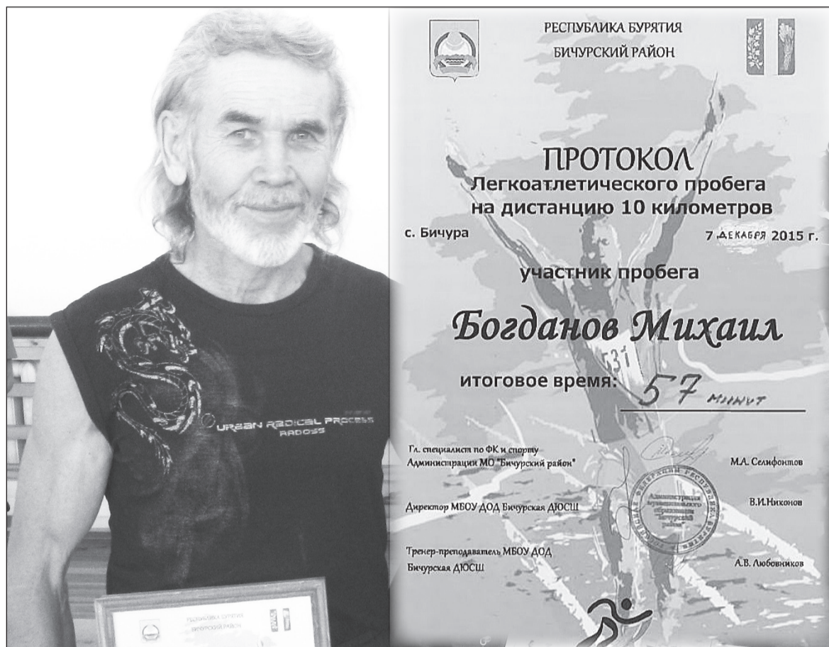
Протокол забега — подарок внуку.

Перед началом учёбы в 5 классе, в силу обстоятельств, нам сказали, что нас «сдадут в детдом». Я убежал на гору, спрятался в осиннике. Думал, что буду сидеть здесь всю ночь и весь следующий день, меня не найдут и уедут в детдом без меня. Однако с наступлением ночи стало страшно и пришлось идти домой. Не забыть того дня, когда меня и моих младших сестру и брата, повезли в Малокуналейский детский дом. Выехали из Бичуры, а с левой стороны было видно, как комбайны убирают