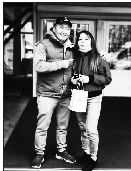
С лучшим тренером