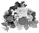
Дочь, зять, внуки, сваты

Поздравляем с годовщиной — Свадьбой из рубина! Ваша пара так прелестна! Идеальная, скажем честно. Сорок лет прожили дружно, Что еще добавить нужно? Вы творцы своей судьбы. Браво! Горько! Молодцы!