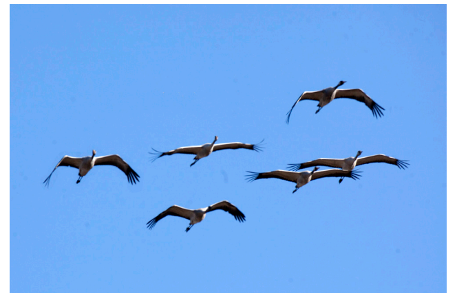
Серые журавли в полёте