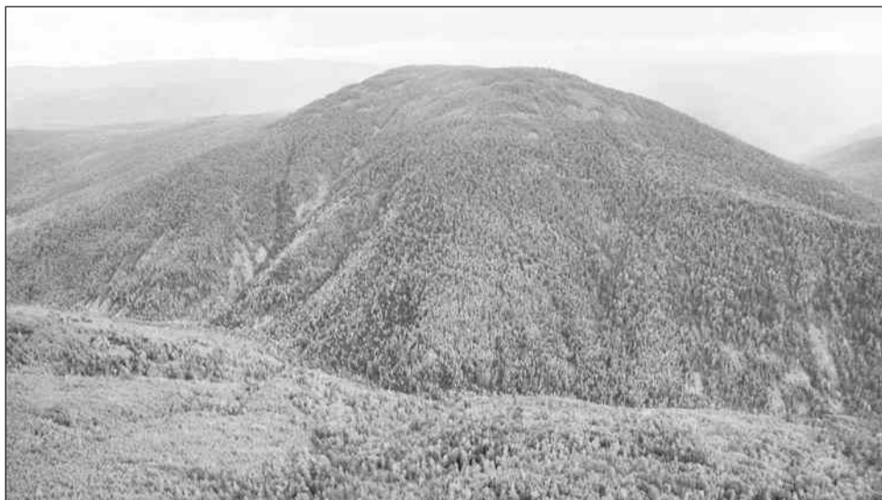
Афонская гора летом

Поход на гору Афонская будет трудным, и вам потребуется проводник. Однако, если не располагаете временем для длительной экскурсии, в окрестностях сопки вы найдёте много интересного. На джипе и подобном полноприводном автомобиле вы можете добраться до большого распадка Таланская. В этом месте речка Бичура сжата крутыми боками горных хребтов, течёт шумно и быстро.