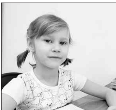
Анкета Ксении: https://www.usynovite.ru/child/?id=7sxn-h800