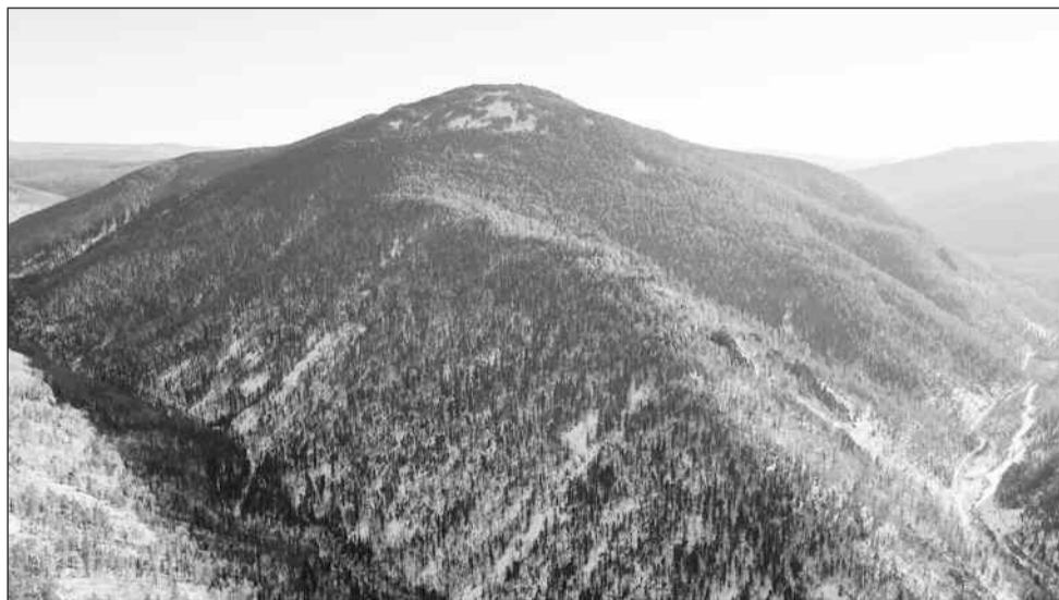
Афонская гора зимой