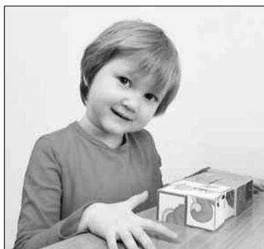
Анкета Екатерины: https://www.usynovite.ru/child/?id=7sxn-gp1c