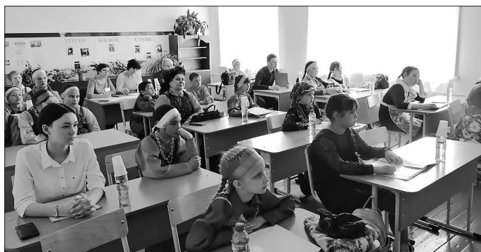
Секция «Летопись родного края»

— Нам прислали положение из управления образования, так мы узнали о том, что в Бичуре будет проходить научно-практическая кон-