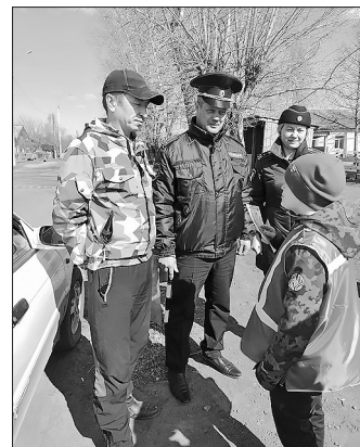
29 апреля юные инспектора движения из Бичурской школы № 4 имени Героя Советского Союза Е.И. Соломенникова участвовали в акции «Дорога без опасности».

В этот день их собеседниками стали водители автомобилей и тракторов, проезжавших по улице Калинина. Ребята напоминали о необходимости соблюдать правила дорожного движения и поздравляли с Пасхой и наступающими майскими праздниками.