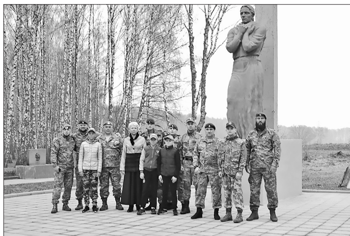
Делегация Бичуры на Кривцовском мемориале.

Одним из 27 пэтээрзовцев был Неизвестный солдат, похороненный в с. Бичура Республики Бурятия 8 мая 2019 года. Но увы, о подвиге бойцов мало кто знает, кроме историков и краеведов, прозванных тех бронепанфиловцев «кривцовскими панфиловцами». При этом все бойцы остались без каких-либо наград, хотя их подвиг аналогичен подвигу 28 панфиловцев, который был совершен в ноябре 1941 года у разъезда Дубосеково под Москвой.