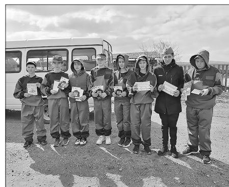
Члены школьного лесничества

Буйский лесхоз, Буйское лесничество и школьное лесничество «Юный лесовод» проводят активную работу среди населения по противопожарной профилактике.