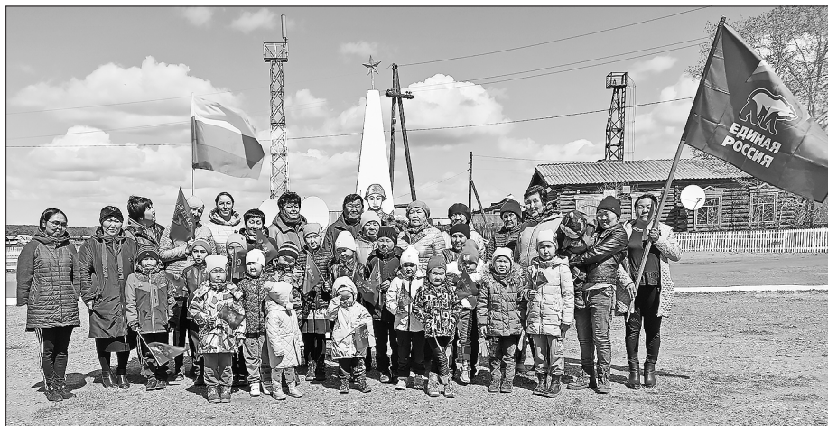
Трагательно встречали в улусе Следний Харлун

На маршруте Бичура — Шибертуй — Дабатуй — Амгалантуй — Шанага — Потанино — Хонхой встречи тоже стали традиционными. Нас ждали, прилегающую территорию и па-