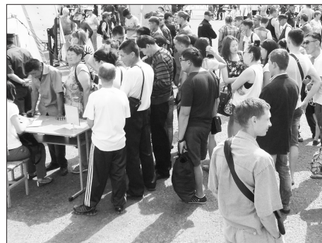
Запись на службу по контракту

избежать безработицы. Намеки более свободны в службе и перемещении: если «срочники» имеют множество ограничений, то современная служба по контракту сравнима с обычной работой.