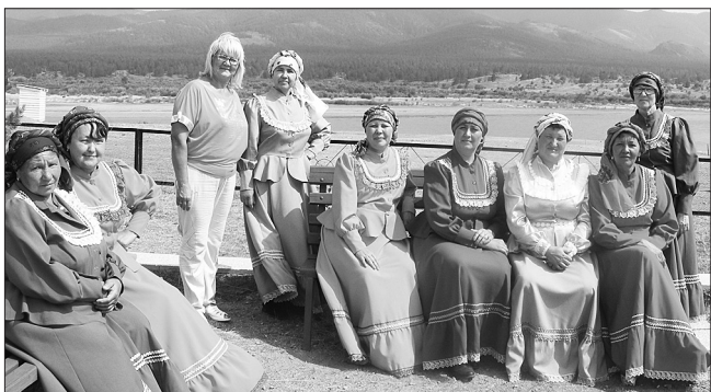
Нарядные казачки «Калинушки»

Бичурская станица — победитель ратных состязаний