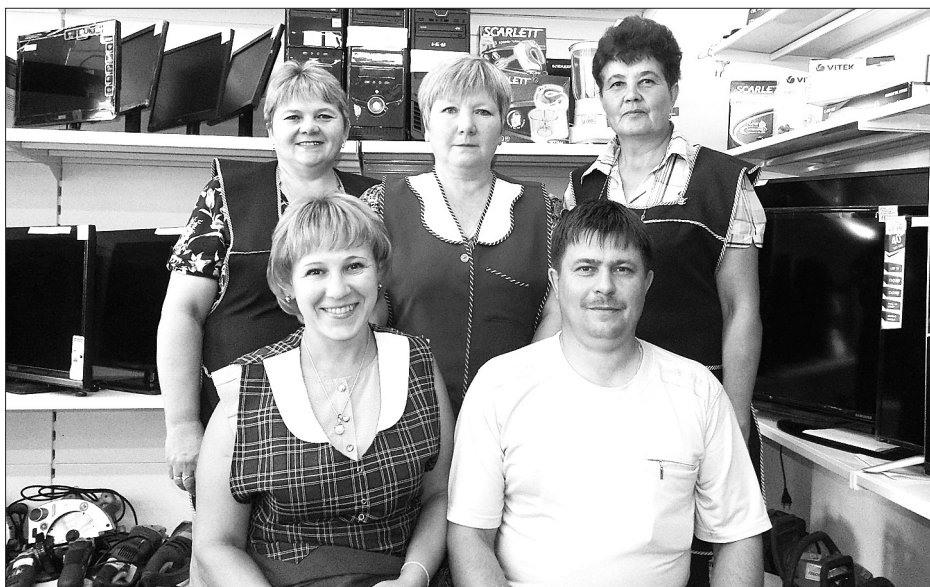
Уровень обслуживания всегда на высоте

В магазине «100 мелочей» всегда рады покупателям