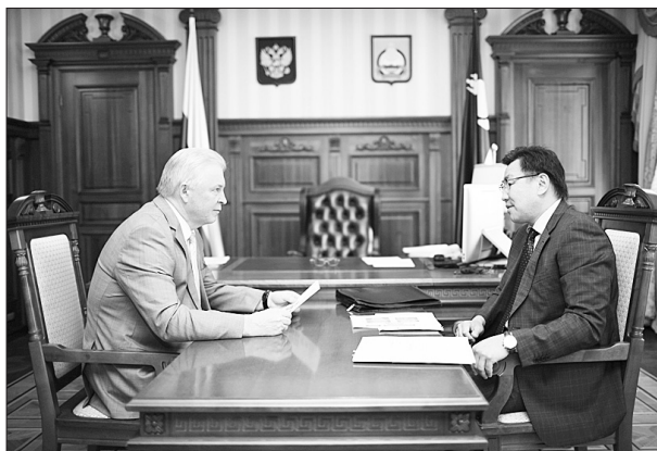
Разговор о поддержке предпринимательства

Число членов ТПП растет, причем не только количественно, но и качественно. Сегодня действующих членов — 85. В том числе ВСГУТУ, БМПК, банки и т.д. Организация защищает своих участников, организовала оказание новых услуг, и не только для членов ТПП. Среди основных направлений Палаты — помощь в налаживании контактов с азиатскими предпринимателями, поиск партнеров, организация логистики. ТПП стала выдавать сертификаты на промышленные и продовольственные товары, поставляемые на экспорт, проводить независимую судебную экспертизу, планирует уже летом организовать независимую оценку кадастровой стоимости — чтобы помочь предпринимателям снизить арендные платежи.