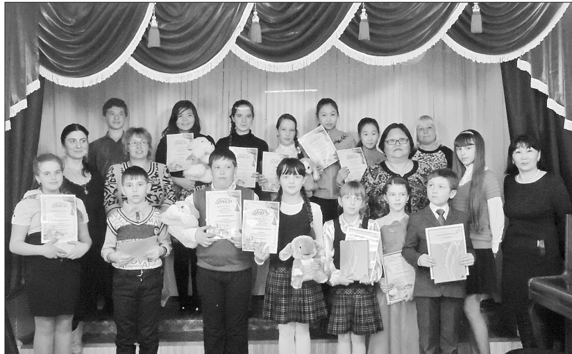
Воспитанники школы — победители межрайонного конкурса