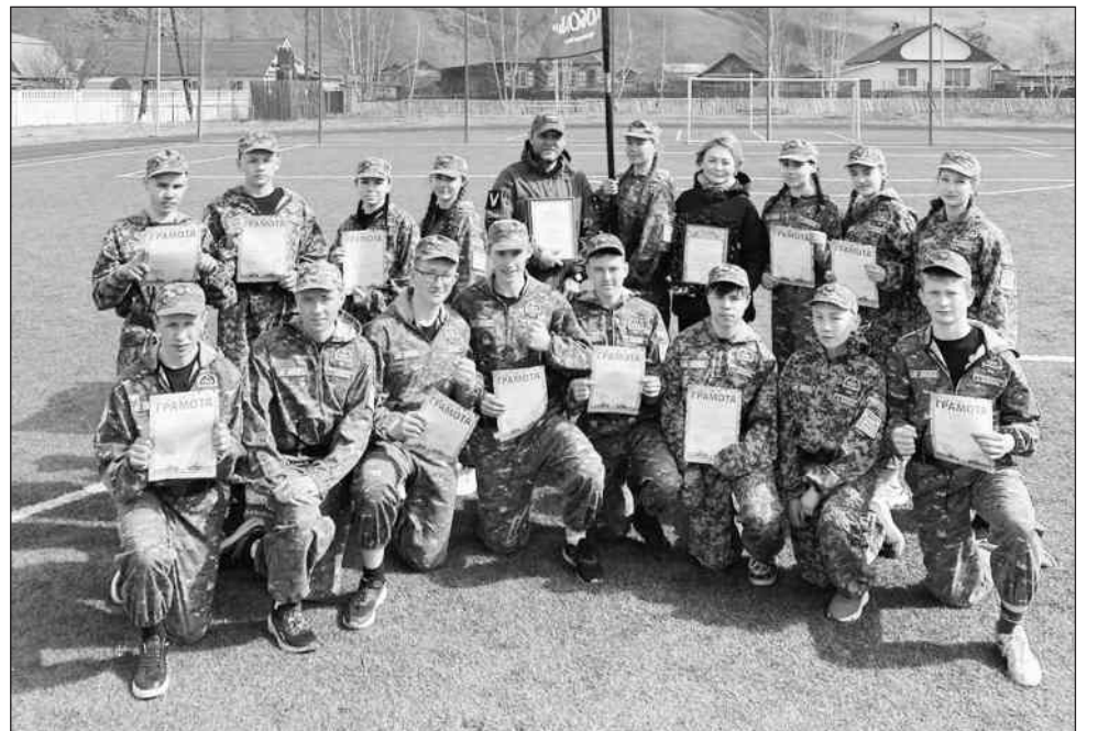
Команда «Соболь» победила на районной «Зарнице-2024»