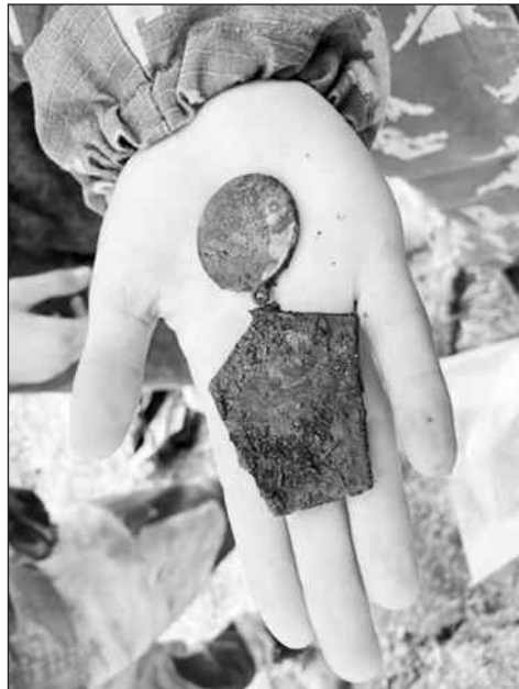
Такую медаль нашли на месте боёв у деревни Кривцово

— Приходя в клуб, ребята часто не знают или не интересуются своими родословными. Перед новичками ставим задачу обратиться к родным и собрать любые факты о своих родственниках и их пути во время Великой Отечественной войны. Выполнив наши задания, они находят исторические документы о своих предках и сами радуются открытиям. Здесь же преследуем задачу сотрудничества с родителями, их участия в воспитании патриотиче-