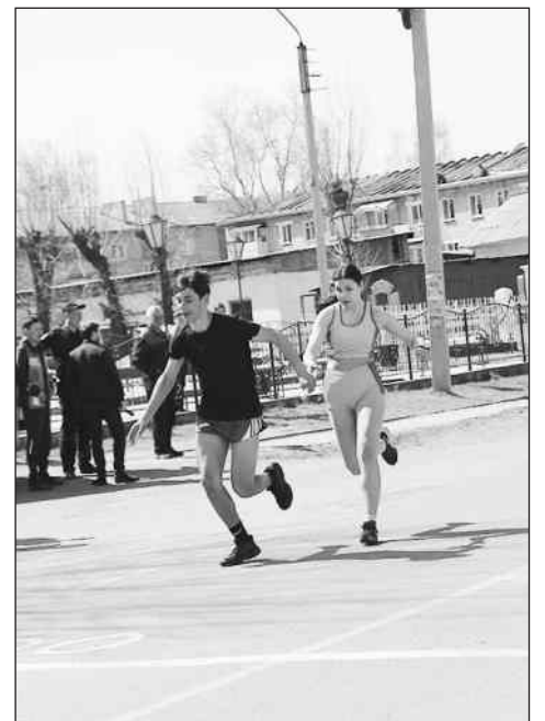
На смене этапов

Благодарим всех участников эстафеты, руководителей и тренеров команд. Спасибо