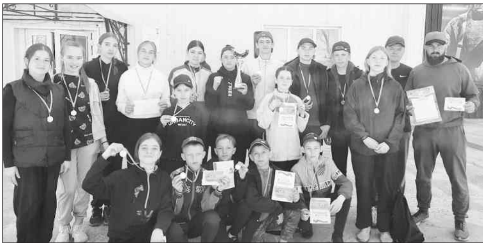
Третий раз переходящий кубок завоевали спортсмены Бичурской школы № 2. Он у них остаётся.

Традиционные майские соревнования на призы газеты «Бичурский хлебоборо» и районной администрации посвящены 79-летию Победы в Великой Отечественной войне.