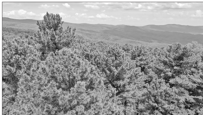
Вершины кедров — здесь царствует кедровка.

Чаще всего мы видим кедровку в кронах деревьев. Там она царствует: добывает пропитание, борется с конкурентами, там у неё гнездо и потомство. В интернете увидел небольшой ролик, снятый на вершине кедрового дерева. Молодой человек ведёт съёмку кедров, рас-