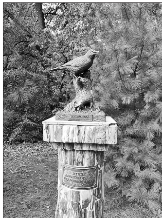
Памятник кедровке в Томске.