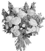
С наилучшими пожеланиями твоя жена

С днем рождения, муж любимый, Поздравляю я тебя! Ты единственный на свете, Ты любовь и жизнь моя. Ты мой щит, моя опора И надежная броня, На твоих плечах, любимый, Наша держится семья. Крепким будь, здоровым, сильным, Меня за руку держи, Я желаю, чтоб с тобой мы Были счастливы всю жизнь!