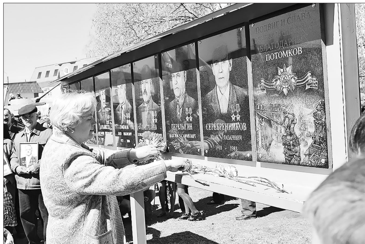
Увековечена память орденосцев Славы