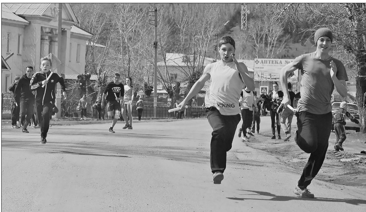
«Горячие» секунды соревнования

В преддверии празднования Дня Победы в Бичуре прошла традиционная легкоатлетическая эстафета на призы администрации МО «Бичурский район» и газеты «Бичурский хлебороб».