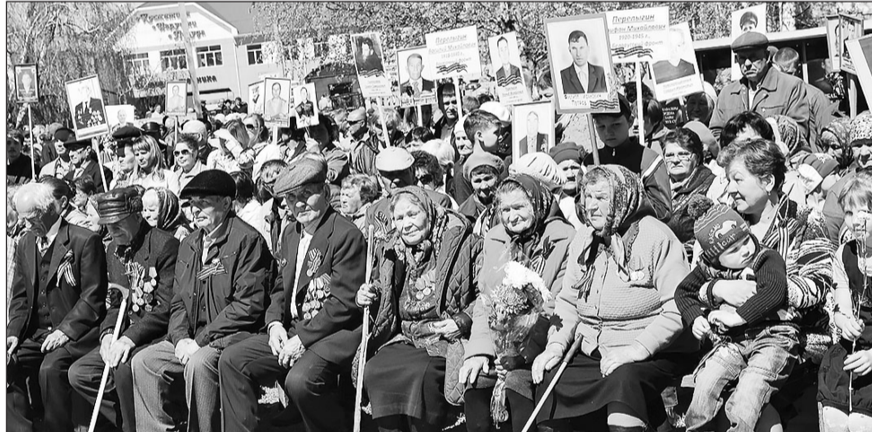
Труженики тыла и дети войны на митинге