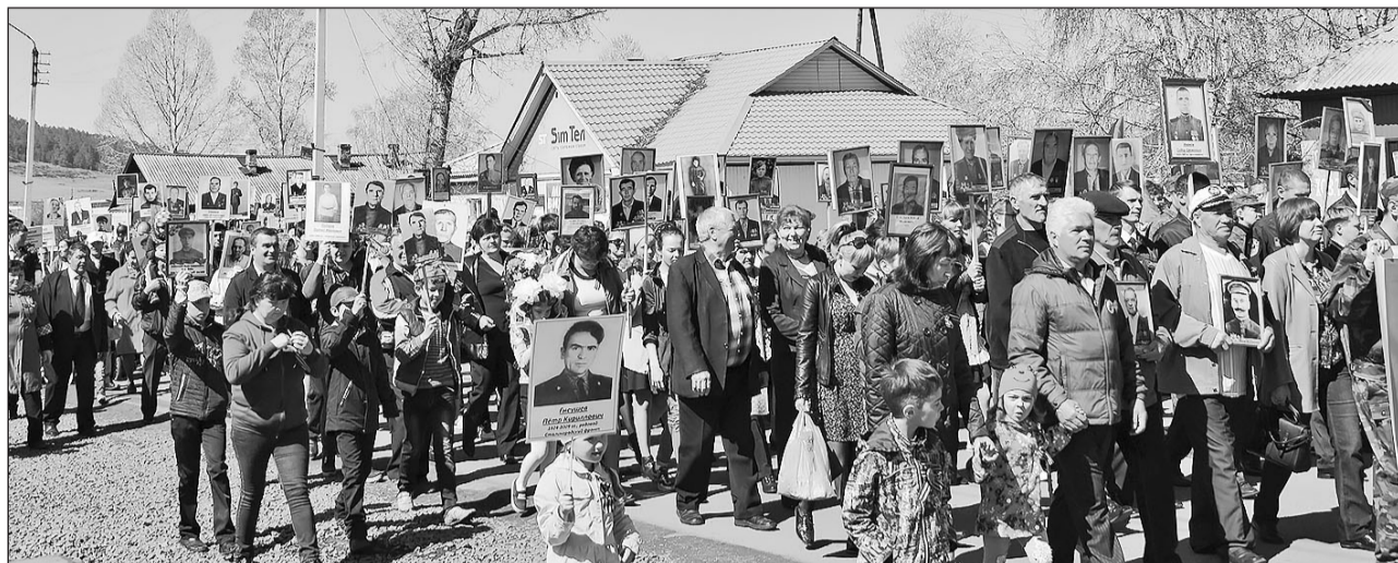
«Бессмертный полк» Бичуры

В День Победы почтить память погибших в грозные годы, отдать дань уважения живым участникам и ветеранам войны, труженикам тыла, детям войны пришли в парк Победы представители трудовых коллективов, сотни бичурян, гости райцентра.