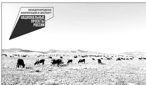
Племенной скот ООО «Победа»

В Бичурском районе уже много лет работает сельхозпредприятие «Победа», которое специализируется на племенном животноводстве. С 2020 года хозяйство приобрело статус племенного завода благодаря высокому уровню селекционной и племенной работы. Сельские хозяйства Закаменского района планируют закупку быков для улучшения породных качеств своих животных.