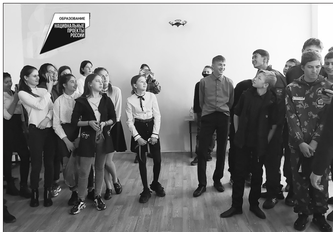
У беспилотных летательных аппаратов безграничные исследовательские и учебные возможности

Такой же Центр образования цифрового и гуманитарного профилей «Точка роста» открылся в Окино-Ключёвской школе. Подобные Центры запланированы ещё в десяти школах района.