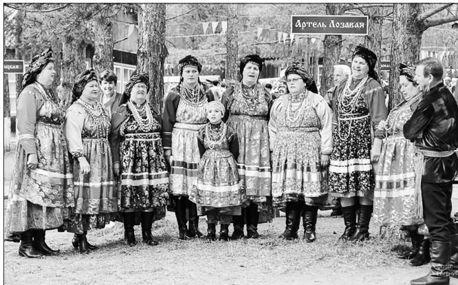
Ансамбль «Воскресенье». https://семкруговая.рф/

15 сентября завершился VI Международный фестиваль культуры семейных старообрядцев «Семейская круговая» в Забайкалье.