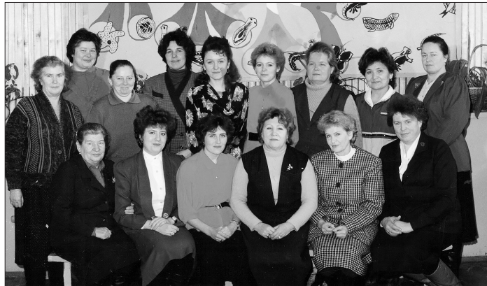
Коллектив Бичурской школы №3, 2009 г.

Расставание со школой — это всегда грусть. Ученики прощаются со школой и учителями, а учителя — с учениками. Профессия учителя — подвиг. Недаром в России люди снимали шапку в благодарность за учительские труды. Говорят: «Учитель жив, пока живы его ученики». Учителя России всегда находились в первых рядах общественной жизни. Часто они выполняли не только свою профессиональную работу, вместе с учениками делали то, что нужно обществу в данный момент.