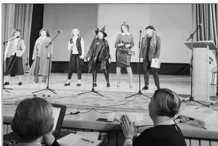
Команда БСОШ №2