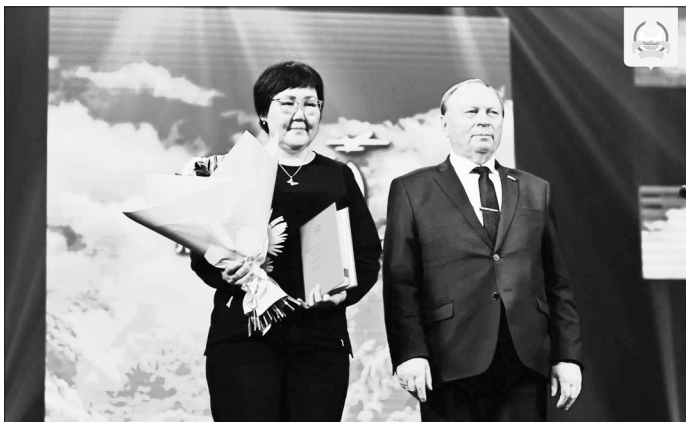
Председатель Народного Хурала Республики Бурятия Владимир Павлов принял участие в торжественном мероприятии, посвященном 100-летию гражданской авиации России.

«На протяжении 100 лет гражданская авиация Бурятии была и остается важнейшей составляющей единой транспортной системы