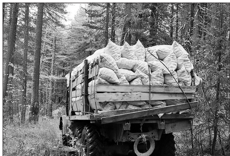
Иногда урожай вывозят шишками

Народная мудрость: «Ценность кедра превышает ценность его древесины»