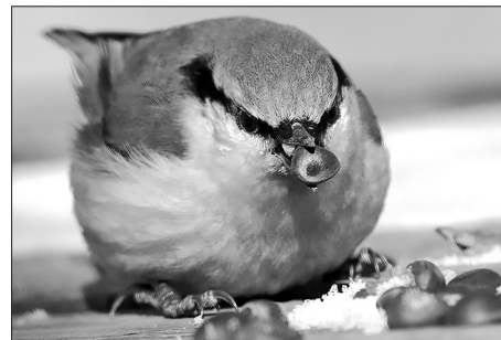
Полпозень выбирает орех с пятном