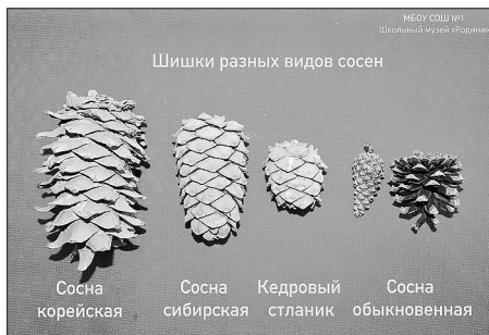
Шишки разных видов сосен