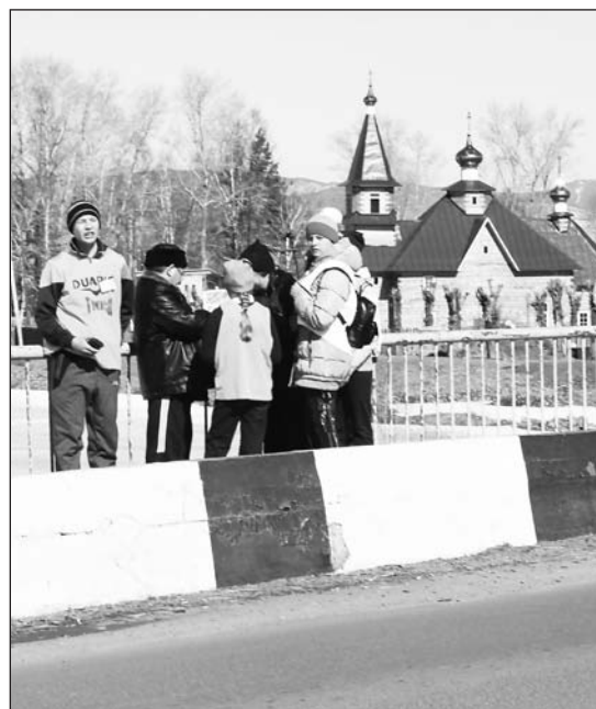
«Поиск» Окино-Ключёвской СОШ

Бичуряне и гости райцентра в прошлую пятницу с интересом наблюдали быстро перемещавшиеся в разных направлениях группы школьников. Их можно было встретить в парках, у памятников, церквей, на мосту, возле утёса... При этом на улицах дежурили автомобили ДПС.