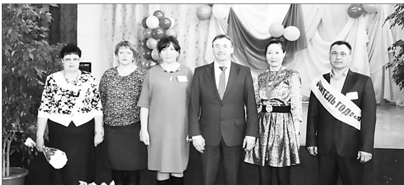
После церемонии награждения

Завершающим испытанием стал методический семинар, где участники поделились опытом работы по своим предметам и вне уроков.