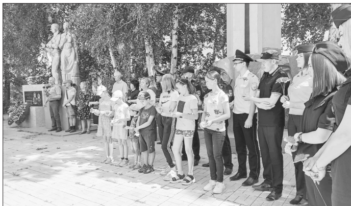
«Это надо живым...»

22 июня в Бичуре в парке Победы состоялся митинг, посвящённый Дню памяти и скорби.