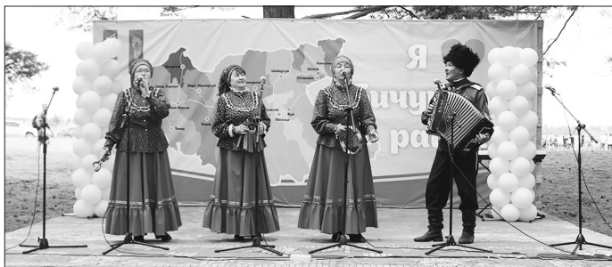
Народный ансамбль «Калинушка», с. Сухой Ручей