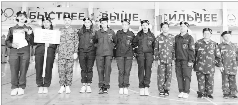
Победители — отряд «Чёрная молния»

22 июня в ФСК «Планета спорта» состоялся смотр строя и песни среди лагерей дневного пребывания школ района. Отряды показывали строевую подготовку, умение выполнять команды и маршировать. Районный конкурс посвятили Дню памяти и скорби.