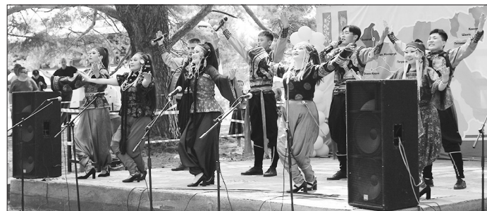
Этно-группа «Аядон», г. Улан-Удэ