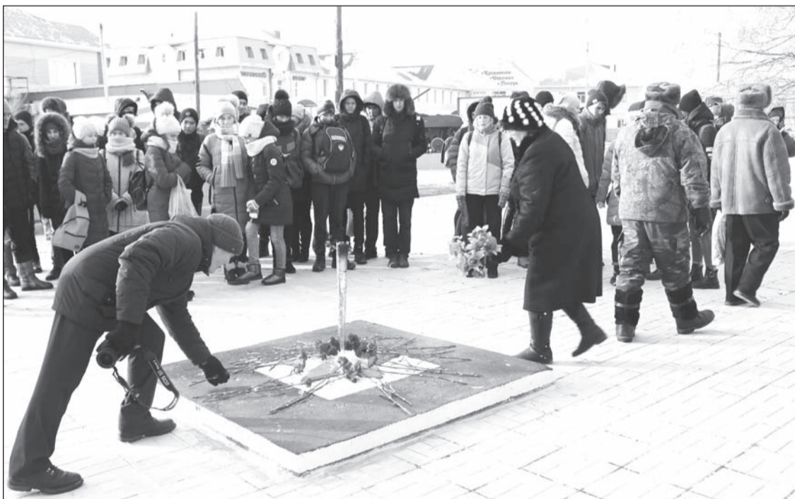
Они живы, пока мы их помним!

Традиционный митинг состоялся в парке Победы