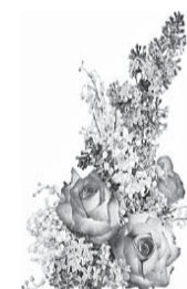
Суважением ваш 11 «а» класс, выпуск 2007 г.

Спасибо вам за дружбу, понимание. И за заботу вас благодарим, За преданность работе, за терпенье. Здоровья крепкого мы пожелать хотим. Своею вы душой оберегали Задорный, дружный, шумный этот класс, За каждого всегда переживали, Да и переживаете сейчас. Ушли уже из школы навсегда мы, Но вас мы не забудем никогда. И с днем рождения вас мы поздравляем, Кричим вам трехкратное «Ура!». Желаем только крепкого здоровья И жить всегда без грусти и тоски. Вы лучший классный наш руководитель, Так пусть у вас сбываются мечты!