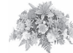
Ваши первые выпускники 1991 года

С юбилеем поздравляем Вас, учитель дорогой. Пусть удачей засияют Звезды ярко над судьбой. Радости, любви, терпенья Мы спешим вам пожелать. А в работе — вдохновенья, Чтоб вершины покорять!