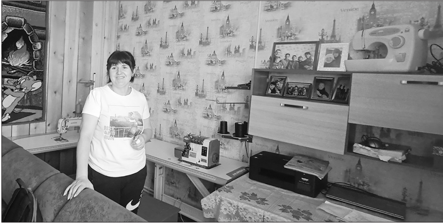
Галина Венедиктова: «Спасибо, что поддержали»