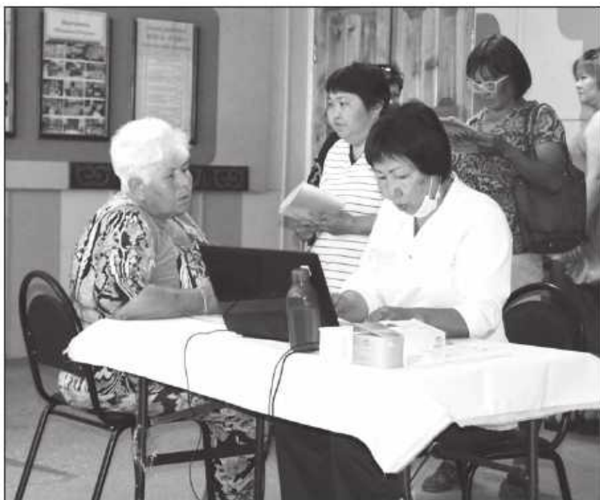
На «Ярмарке здоровья» в РДК

Агитпоезд «Тур здорового образа жизни» побывал в районе