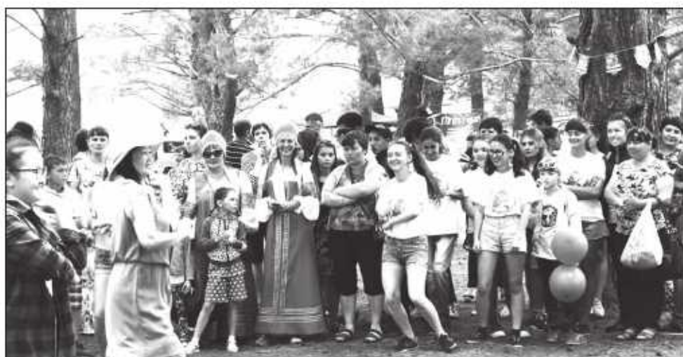
Команды волонтеров поддерживали друг друга