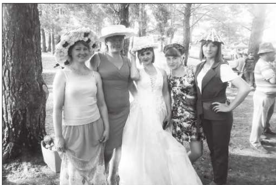
Победители «Шляпного гламура»