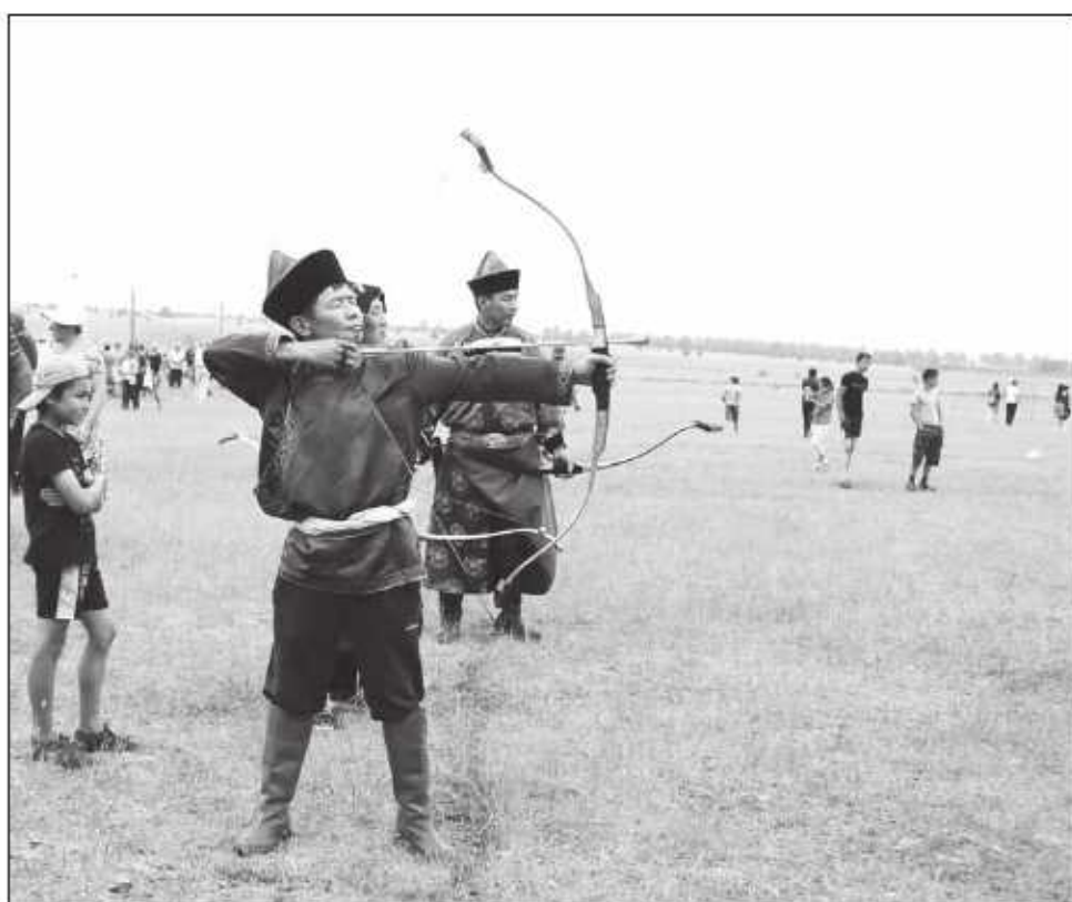
Ежегодно проходят соревнования среди лучников