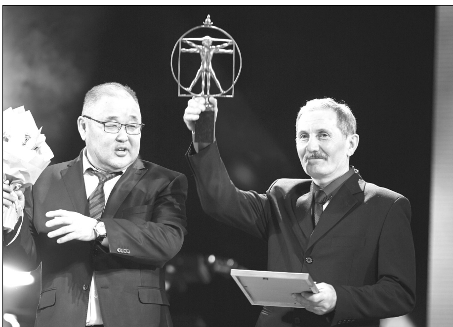
Приз вручает депутат Народного Хурала РБ Зоригто Цыбикмитов

Седьмой раз ИД «Информ Полис» называет лауреатов