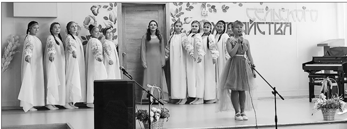
Из концертной программы