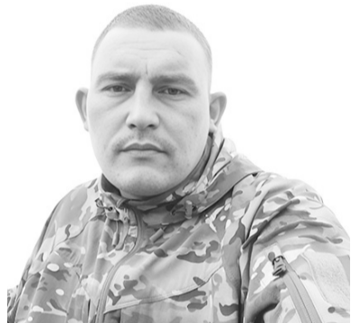
Администрация Бичурского района, жители района