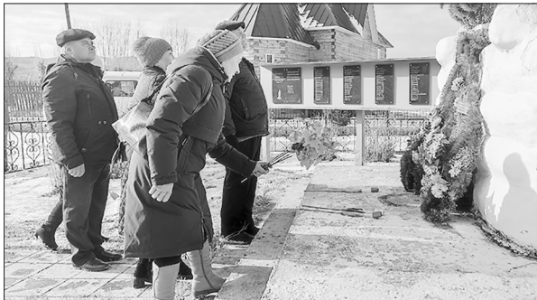
В парке «Молодёжный» состоялся митинг «И скорбь, и память, и покаяние»

Во время сталинских репрессий в Бурятии пострадало около 20 тысяч человек, больше 1,5 тысяч — из нашего района. Жертвами репрессий становились и известные, и обычные люди. По доносам забирали невиновных. Обвинения были безосновательными, а наказания чрезмерно жестокими, вплоть до расстрела. Имена тех, кого объявили врагами народа, сослали в лагеря и лишили жизни, занесены в Книгу памяти жертв политических репрессий.