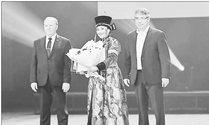
Говоря же о важности сохранения и развития языка, он отметил следующее: «Депутатами Народного Хурала Бурятии принят ряд законов по сохранению и разви-