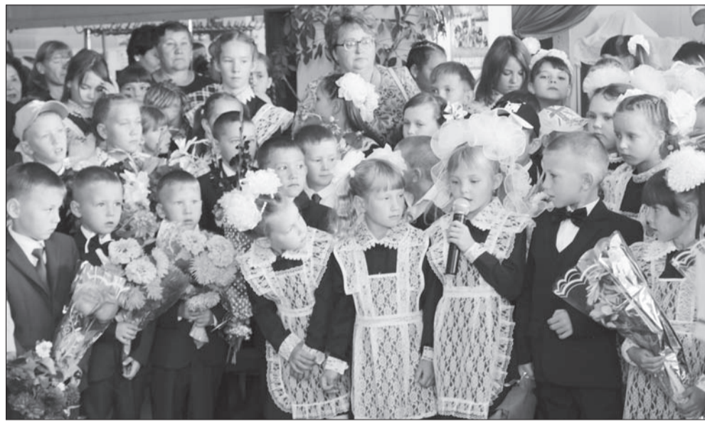
Из дошкольников — в первоклассники