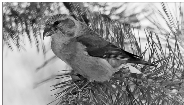
Клест прятается в ветвях