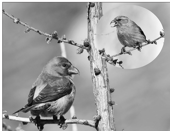
Момент ссоры клестов