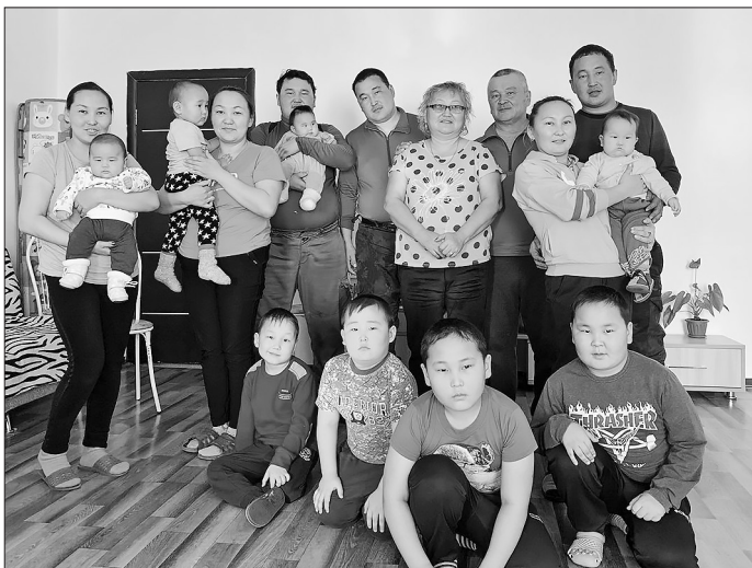
Когда все вместе, то и душа на месте