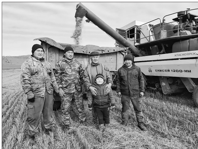
На уборке урожая