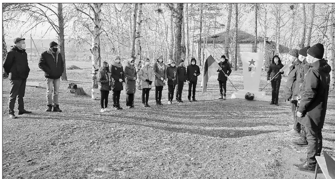
Мероприятие проходило с соблюдением всех необходимых санитарных норм.