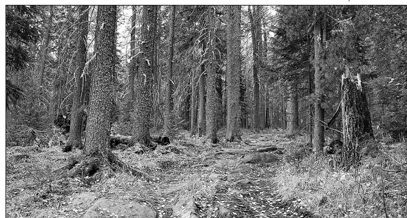
В кедровом лесу — перезвон клестов