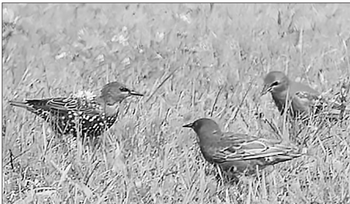
Скворцы на отдыхе