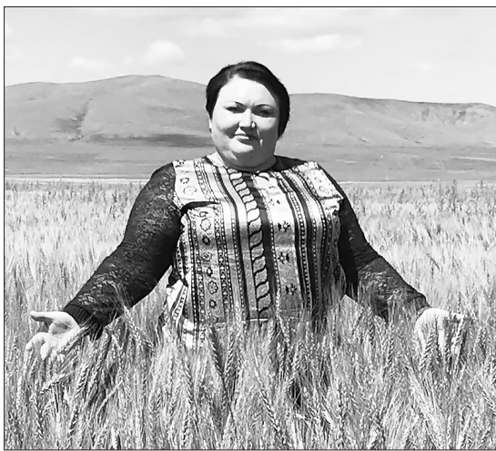
Где родился, там и пригодился