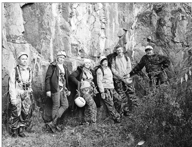
Бичуриане победили на республиканском турслёте

— Для меня всё было новым. Впервые увидела, услышала и выучила названия туристическо-