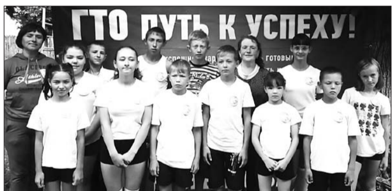
Ребята с нашего двора. 2017 год