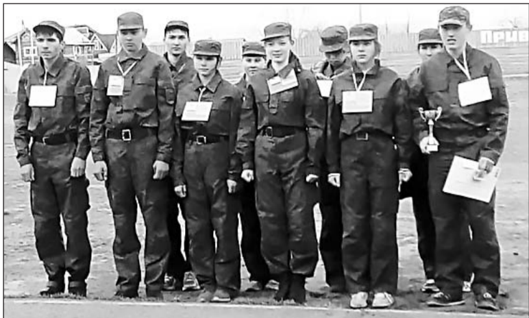
Военно-патриотический клуб «Родина-Бурятия» МБОУ «Бичурская СОШ №4»