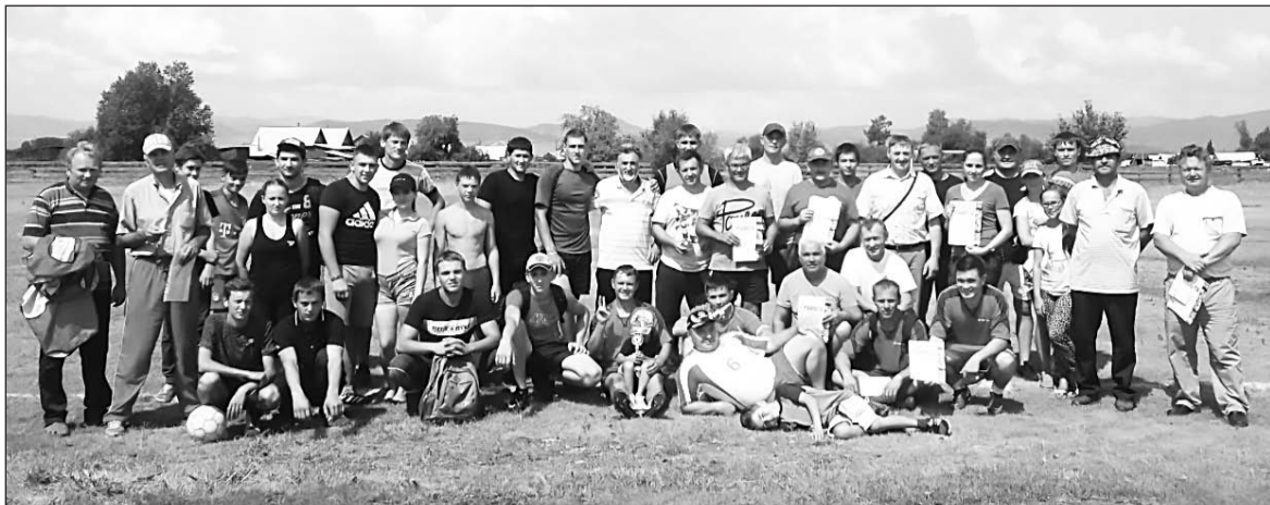
День физкультурника. 2017 год