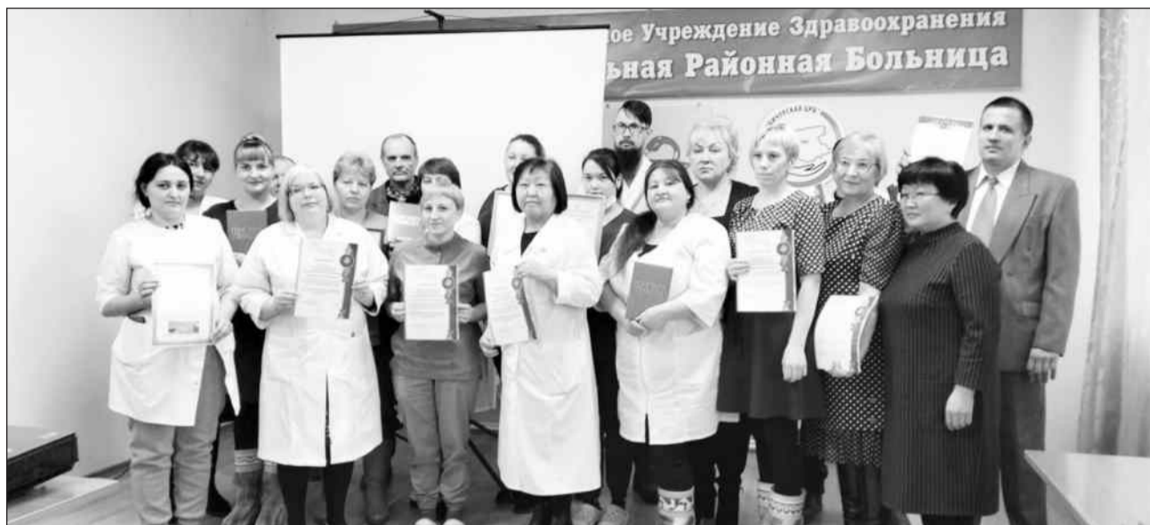
Работники здравоохранения получили награды

Основные задачи при проведении диспансеризации в 2024 году: активное приглашение лиц, не обращающихся в медицинские учреждения в течение 2-х и более лет и качественная работа по коррекции факторов риска развития хронических неинфекционных заболеваний.