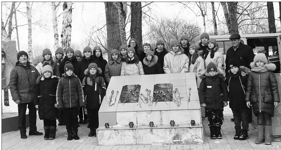
«Имя твоё неизвестно, подвиг твой бессмертен!»

В парке Победы почтили память погибших и пропавших без вести в годы Великой Отечественной войны. Сюда пришли представители руководства района, ветераны труда, ветераны боевых действий, ученики Бичурской школы №1.