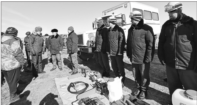
Проверка готовности сотрудников авиалесоохраны