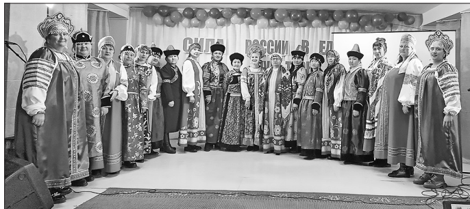
Сила России в единстве культуры