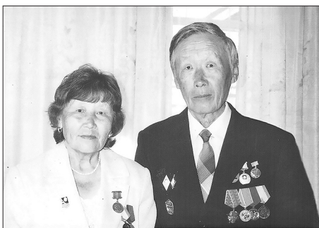
Супруги Гомбоевы.

Отец больше 20 лет руководил родной Харлунской школой. Работая директором, много внимания уделял качеству и эффективности учебного процесса, проблеме нравственного воспитания детей. По итогам учебно-воспитательной работы и хозяйственной части школа постоянно занимала призовые места в районе. Под его руко-