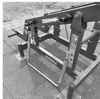
Тренажёр требует ремонта