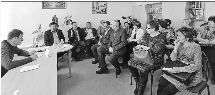
На одной из площадок «мозгового штурма»

25 марта в Малом Куналее состоялось стратегическое совещание работников культуры Бичурского района.