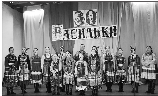
В семейских песнях — душа народа

Сценическое имя фольклорный ансамбль с честью защищал на многих республиканских, всероссийских и межрегиональных конкурсах и фестивалях. Основа его репертура — старинные семейские песни, ча-