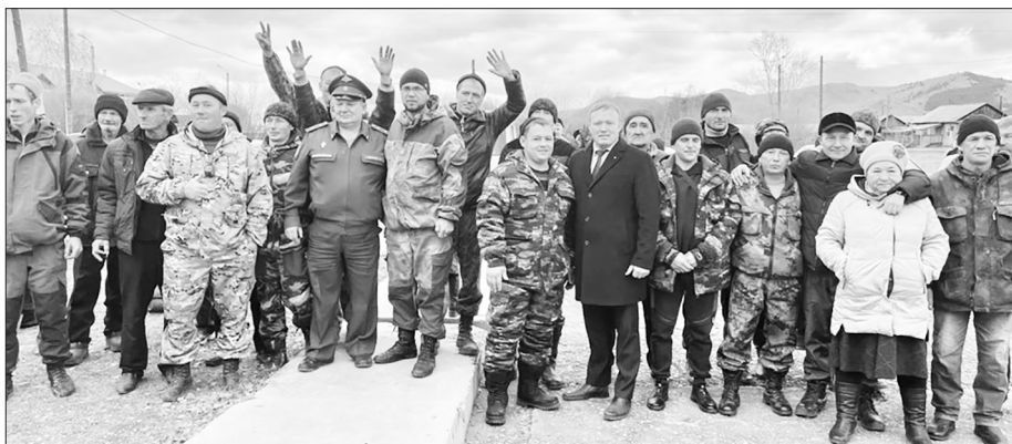
Глава района пожелал всем мобилизованным вернуться домой живыми и здоровыми

В районной администрации созданы штаб и комиссия по оказанию помощи семьям военнообязанных, призванных по частичной мобилизации.