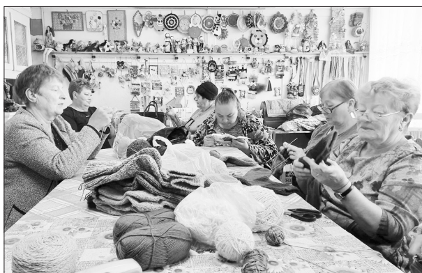
Жительницы Малого Куналея за работой

ТОСы Малого Куналея «Берегиня», «Молодёжный», «Заря» организовали движение «Тепло материнских рук». Обратились к жителям села и района присоединиться к помощи нашим землякам, которые участвуют в специальной военной операции. Начали вязать шерстяные носки для солдат. Нужны были и те, кто умеет вязать. Создали группу в вайбере «Тепло материнских рук». Началось с того, что организовали срочный сбор средств для своего односельчанина и батальона, где он служит.