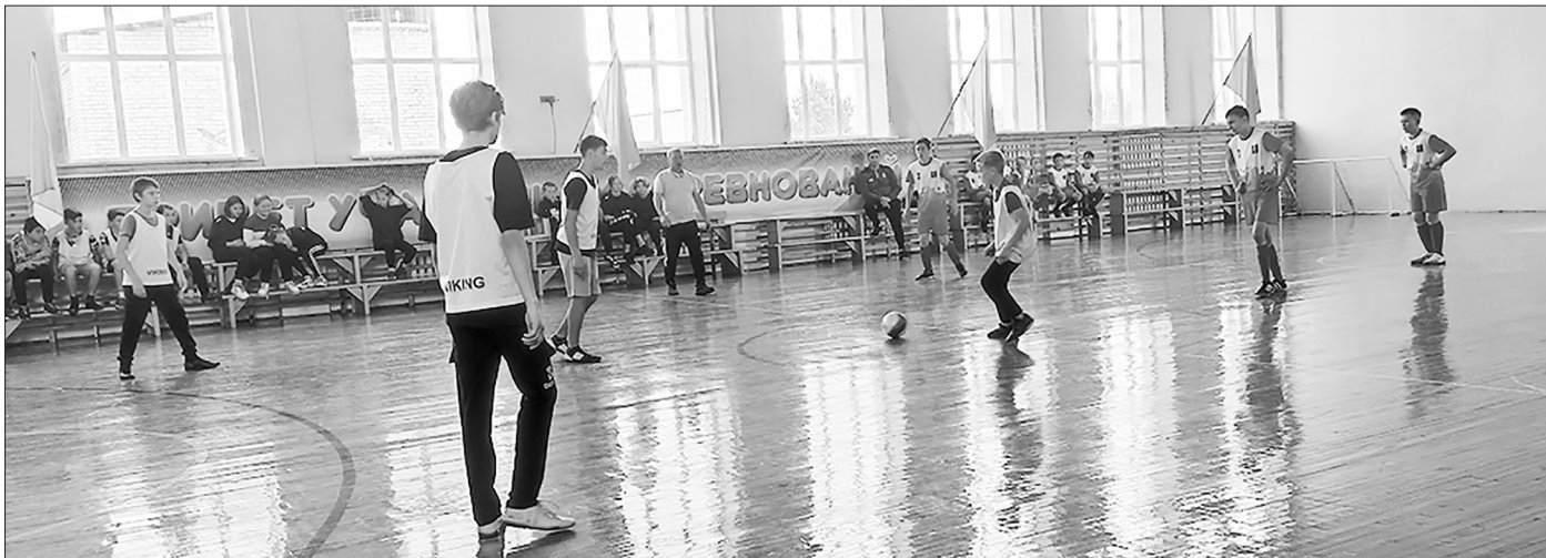
Игра между командами «Бенди» и «Кедр» (2006-2007 г. р.)

Традиционный турнир памяти погибших лесников провели в Бичуре