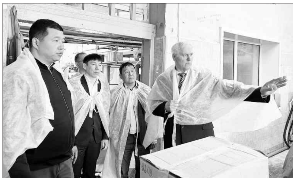
ООО «Бичурский маслозавод»