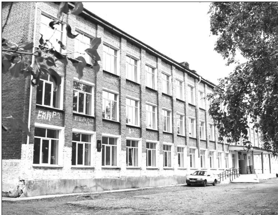
Здание Бичурской СОШ №1 сдано в эксплуатацию в 1972 году

В рамках реализации федеральной программы «Содействию созданию в субъектах Российской Федерации новых мест в общеобразовательных организациях» в 2017 году из федерального бюджета выделены средства на капитальный ремонт зданий общеобразовательных организаций, а также выделены субсидии по созданию условий для занятий физической культурой и спортом в школах, расположенных в сельской местности. По этой программе удалось привлечь средства на капитальный ремонт Бичурской СОШ №1.