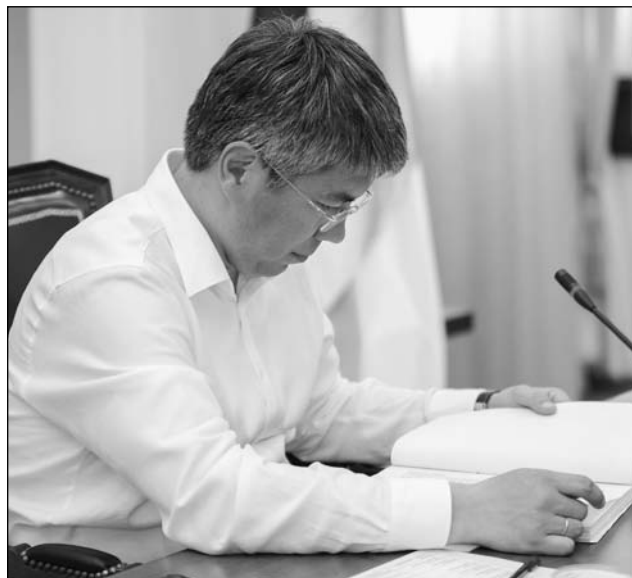
Исполняющий обязанности Главы Республики Бурятия Алексей Цыденов вместе с учеными республики определил пути развития региона до 2022 года.

щение дает хорошее здравоохранение, образование и культура. А также инфраструктура, например, хорошие дороги. Это качество жизни, — отметил Алексей Цыденов.