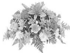
Сестра, брат и их семья

Прекрасный возраст 60. Его прожить не так-то просто. В кругу семьи, в кругу друзей Желаем встретить 90. Живи, родной наш, долго-долго И не считай свои года. Пусть радость, счастье и здоровье Тебе сопутствуют всегда!