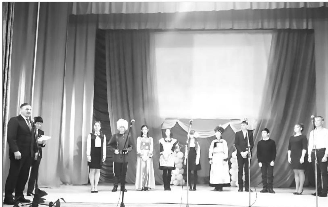
Участники конкурса на сцене РДК

В районном Доме культуры 9 февраля прошёл муниципальный этап конкурса «Ученик года-2018», посвящённый 95-летию Республики Бурятия. За звание лучшего ученика боролись представители Бичурских школ №1, 2, 3 и 5, Еланской, Киретской, Малокуналейской, Окино-Ключевской, Посельской, Потанинской и Шибертуйской.