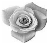
Дети, внуки, правнуки

80 — прекрасный возраст И блестящий юбилей! Пусть не покидает бодрость, Сердце бьётся веселей! Пусть здоровье не подводит Год за годом, день за днём! И, как прежде, пусть приходят Радость и удача в дом!