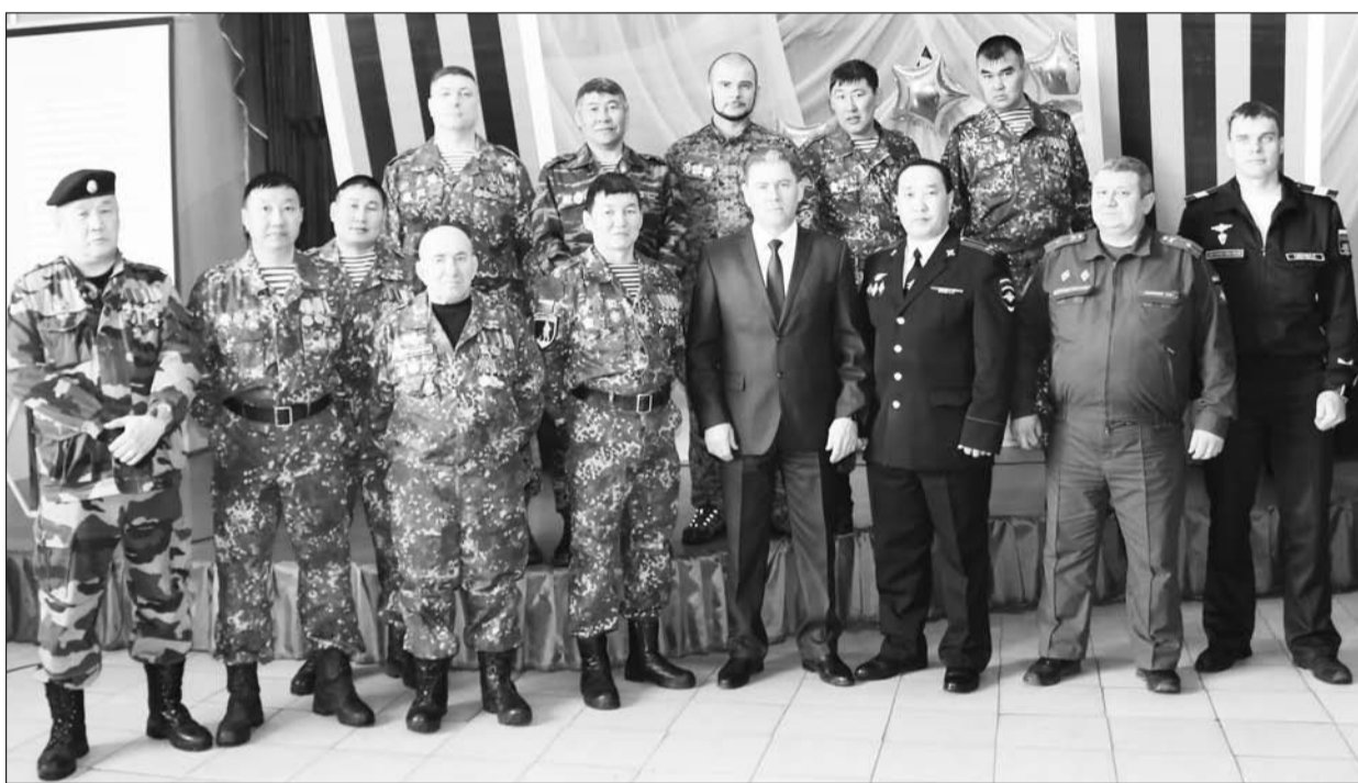
Ветераны «Боевого братства» в Бичуре

Патриотическое воспитание — важное направление работы