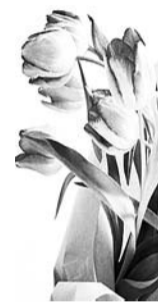
Муж, сыновья, невестки и внуки

Когда приходит 55, Жизнь начинается опять. Нужно побольше танцевать И за границей отдыхать. Вершины снова покорять, Побольше двигаться, не спать. Сегодня быть среди друзей, Хороших пригласить гостей. Желаем столько же опять Тебе прожить, не горевать. Веселья, счастья и любви. Улыбку миру ты дари!