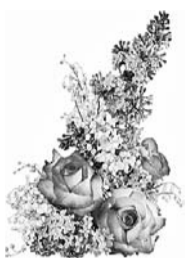
Муж, дети, внуки, правнуки

Десять раз по восемь лет — Это долгой жизни след. Ты — история живая, А для нас — душа родная! Будь здорова, не болей, О прошедшем не жалея, Очень любим мы тебя, Пожелаем же, любя: Нам на радость жить подольше, Счастья увидеть побольше! Внуков, правнуков растить И всегда веселой быть!