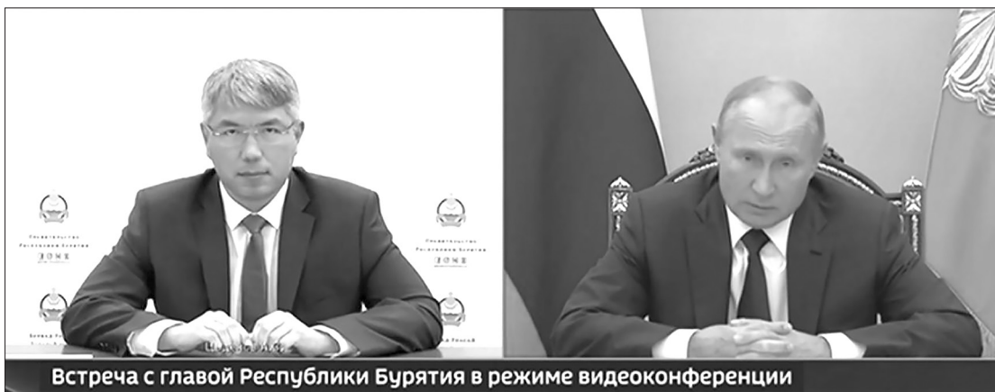
Встреча с главой Республики Бурятия в режиме видеоконференции

Владимир Путин встретился с главой Бурятии Алексеем Цыденовым в режиме видеоконференции. Президент страны хвалил Бурятию, давал наказы, с просьбами главы Бурятии согласился и назвал их важными. Алексею Цыденову встреча удалась, что не всегда случается с региональными лидерами на встречах с президентом.