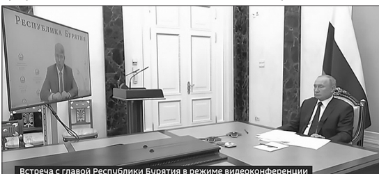
Встреча с главой Республики Бурятия в режиме видеоконференции