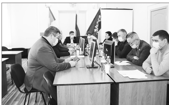
Развитие молочного животноводства обсудили в районной администрации