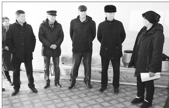
Ара-Киреть. На пункте приёма молока