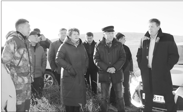
На полях ООО «Победа»

Депутаты Хурала с рабочей поездкой в Бичурском районе