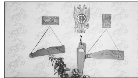
В доме и во дворе рукотворные изделия мастера