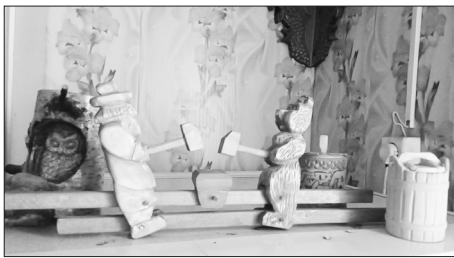
Богородская игрушка «Кузнечи»